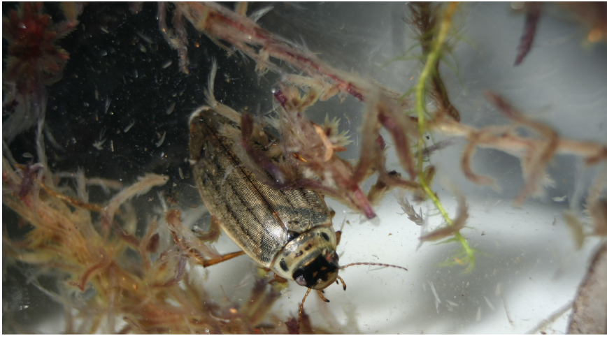
Figur 1: C. dolabratus , der kendes på de fint og tæt tværstribede dækvinger (små striber på tværs af og mellem de kraftige længdestriber).