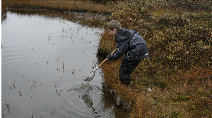
Figur 2: Typisk levested for C. dolabratus : Dam med hestehale, Hippuris .