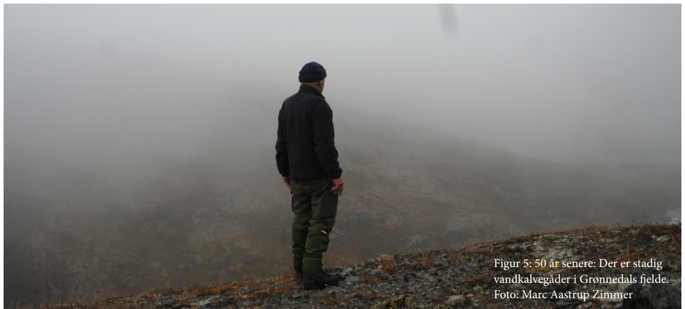
Figur 5: 50 år senere: Der er stadig vandkalvegåder i Grønnedals fjelde.

Fysisk gælle: Under isen kan C. dolabratus hente den smule ilt, den har brug for, i det kolde vand. Den presser en iltfattig luftboble ud fra bagenden, og da der er mere ilt (større iltryk) i vandet end i boblen, sker der en netto-diffusion af ilt ind. Boblen svinder dog, fordi der også siver kvælstof ud, så der er grænser for, hvor længe C. dolabratus kan overleve under isen. Den har på både øst- og vestkysten en klar nordgrænse (Böcher 1988), der sikkert er bestemt af isdækkets varighed.