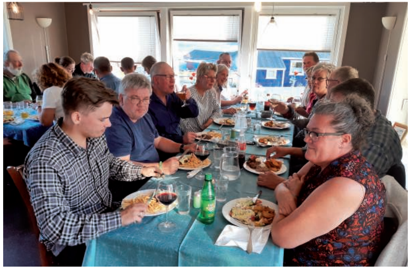
Middagen nydes med største velbehag

Kl. blev 18:30, og det var tid til fælles middag. Hotellet havde sørget for plads til os alle ved et langt stort bord, og snart efter fik vi serveret de bestilte retter. Det havde været flot solskin hele dagen, hvorfor vi hurtigt blev enige om, at vi skulle tage ud til kysten og nyde solnedgangen, men... humøret under aftensmaden var højt, mens dagens oplevelser livligt blev drøftet og... tiden løb.