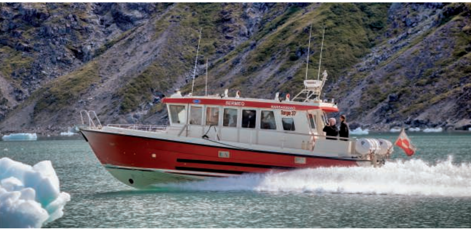
I fuld fart på vej mod Qooroq Isfjord

Første stop var Qooroq Isjord, som ligger syd for Narsarsuaq. I bunden af Qoorog Isfjord findes en aktiv bræ. Al den is, som ligger i fjorden ved Narsarsuaq, kommer herfra.