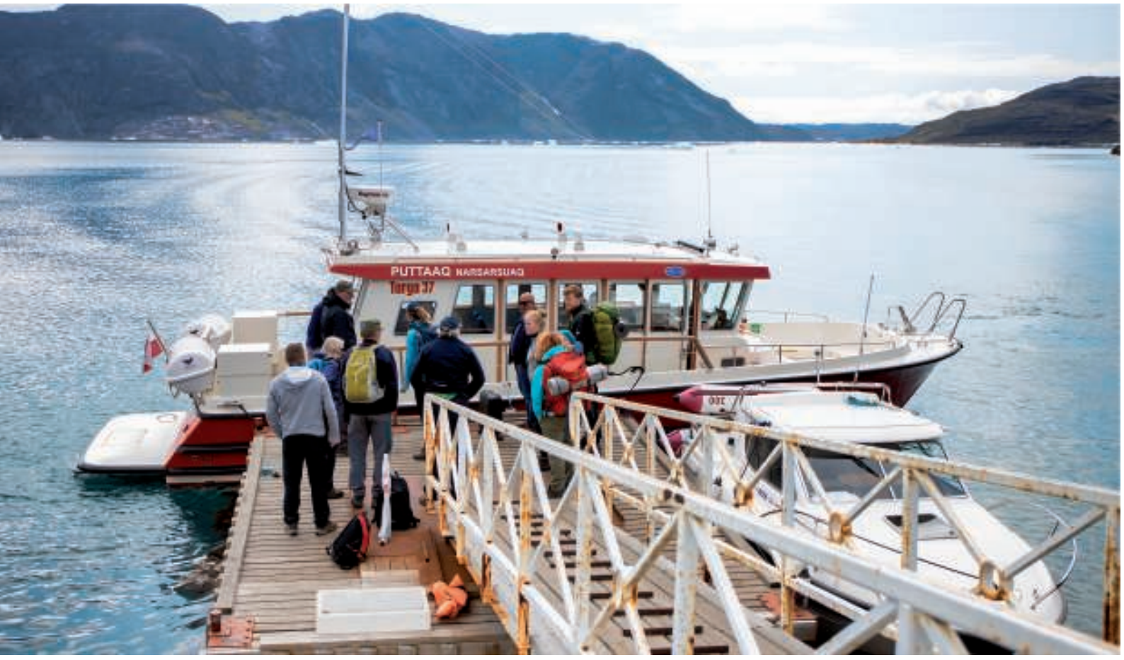
Så er vi ankommet Narsaq. Baggagen kom hurtigt i land, da båden skulle fortsætte mod Qaqortoq

Vi ankom kl. 13:30 ankom, og bagagen blev hurtigt bragt i land. Der stod allerede nye passagerer klar, som skulle videre til Qaqortoq.