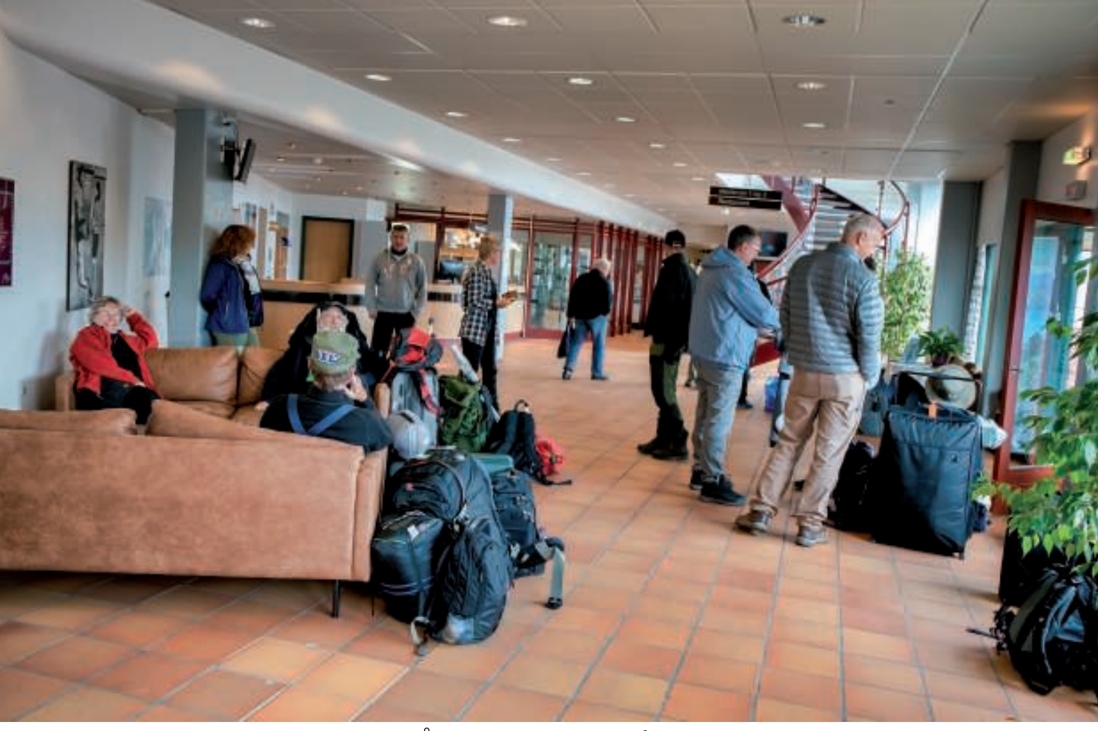
Så er der pakket - klar til afgang

Der var afgang fra Hotellet til aftalt tid, og vi blev kørt ned til havnen, hvor to hurtiggående motorbåde (Targa 37) både ventede på os - vi var klar til næste etape.