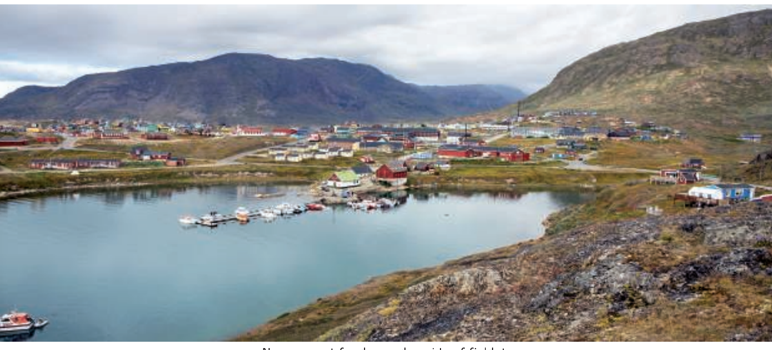
Narsaq - set fra den anden side af fjeldet

Eftermiddagen blev brugt på at trave byen rundt og tage nogle billeder, købe lidt ind og nyde det gode vejr.