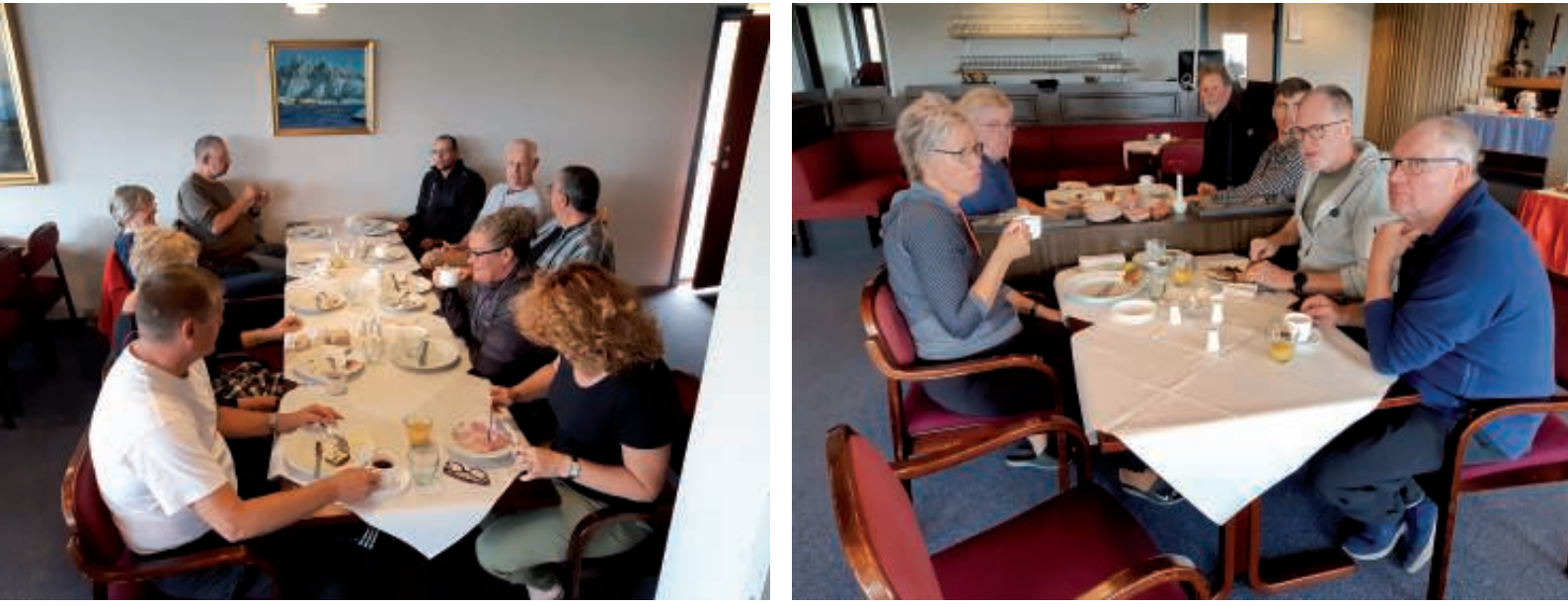
Morgenmadsbuffeten nydes inden dagens sejlads

Det var gudskelov klaret op, og solen kunne allerede ses på himlen. Dagen startede med den obligatoriske morgenmadsbuffet.