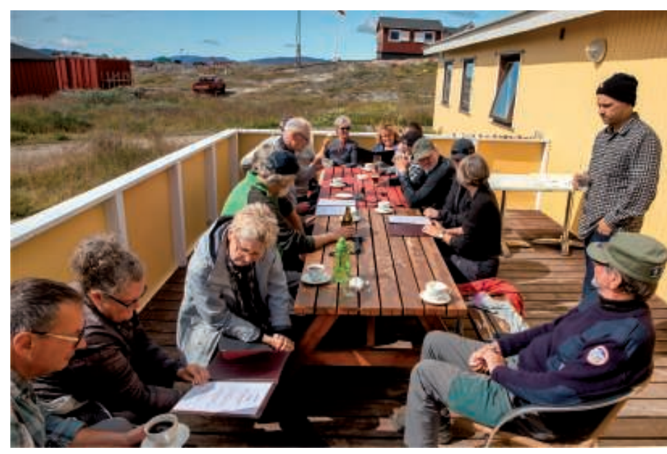
Velankommet nydes en kold øl eller en kop kaffe på Hotellets terrasse. Samtidig bestilles aftensmaden.

Vi aftalte hurtigt at spise middag samlet, dels for at gøre det nemt for både hotellet og os selv, og dels for at sikre, at vi fik maden på samme tid. Mens vi nød det gode vejr på terrassen, gennemgik vi menukortet ogbestilte den ønskede menu.