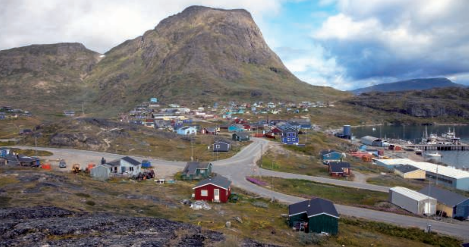
Narsaq - med havnepartiet til højre.