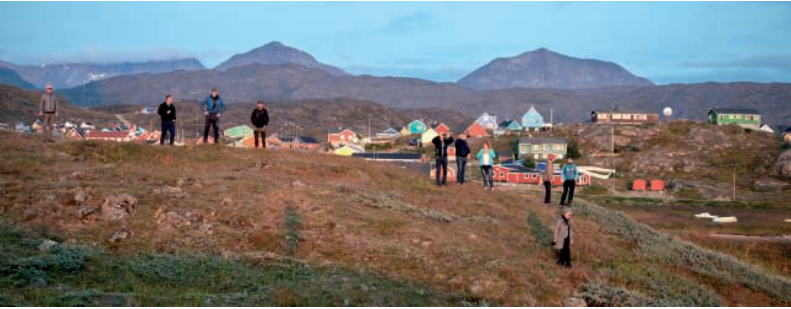
Vi gjorde klar til at se solnedgangen

Pludselig var klokken blevet mange. I al hast blev middagen betalt, og turen gik i rask trav mod et udkigspunkt nord for byen med udsigt ud over Narsaq Sund en vandre-tur på godt 3 km. Vi nåede det. Solen skinnede flot ud over Narsaq Sund med mange smukke isfjelde. Snart efter forsvandt den blodrøde sol ned bag fjeldene i baggrunden – et magisk øjeblik.