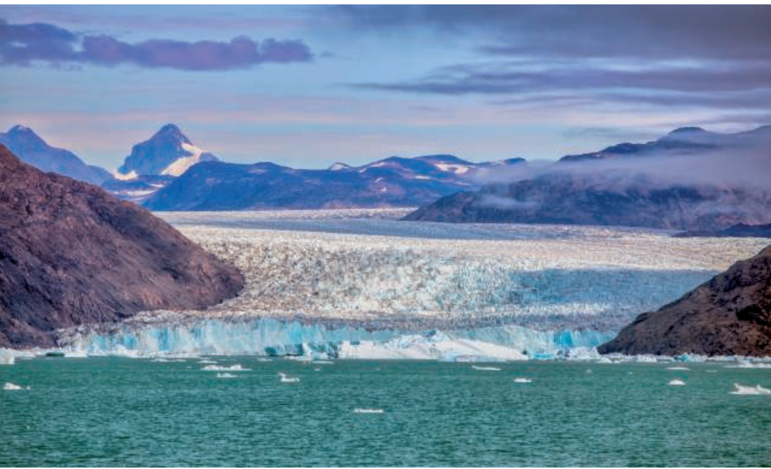
Qooroq Isfjord med bræen i baggrunden

Vi sejlede ind i fjorden, og koncentrationen af is blev større. Jo længere vi kom ind, des flere isskosser mødte vi. Bådførerne var yderst kompetente og sejlede i fuld fart forbi dem. Skosserne blev til isfjelde, og det varede ikke længe, før bræen kom til syne – et fantastisk skue.