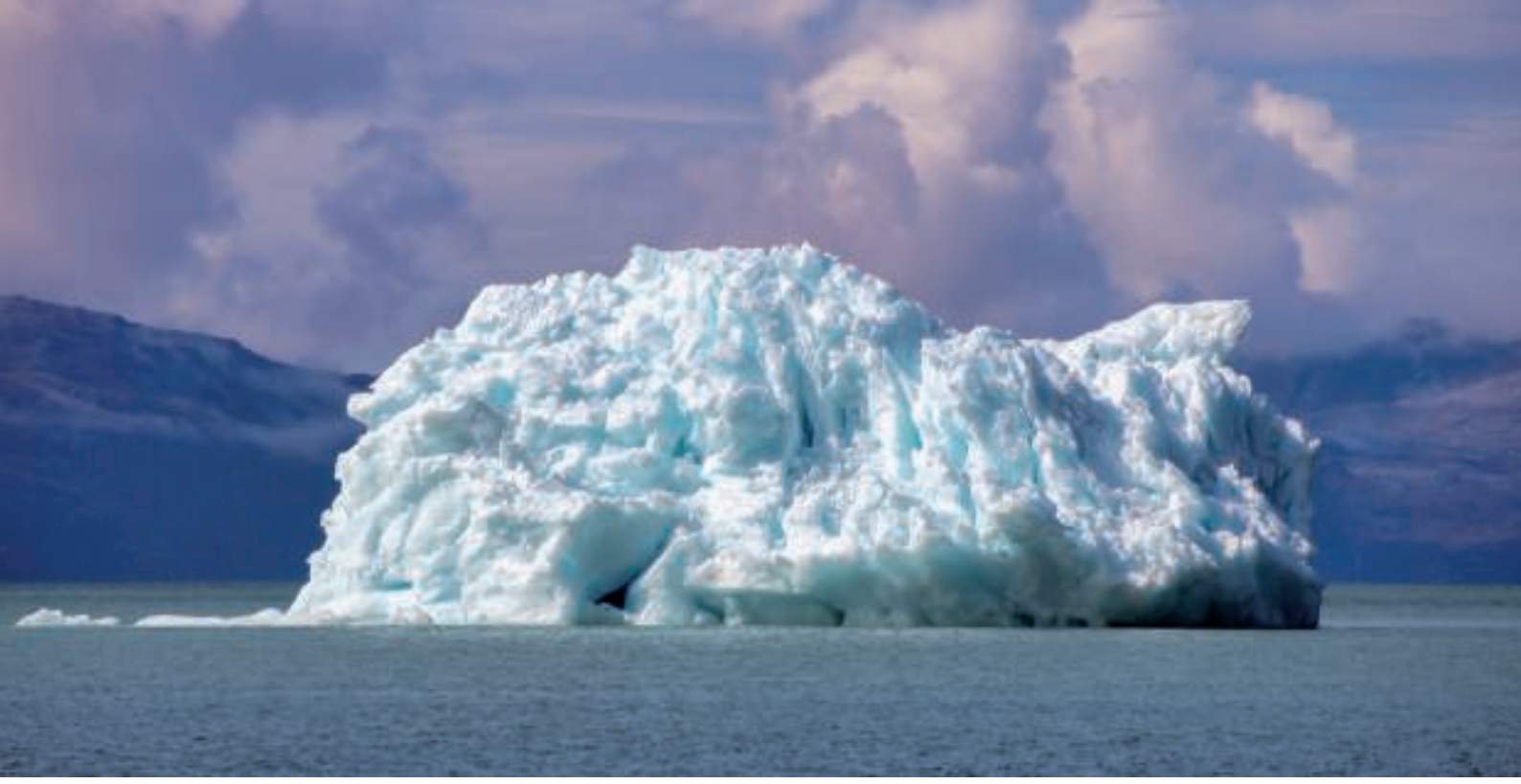
På vej mod Narsaq så vi flere store isfjelde. De skulle selvfølgelig fotograferes.