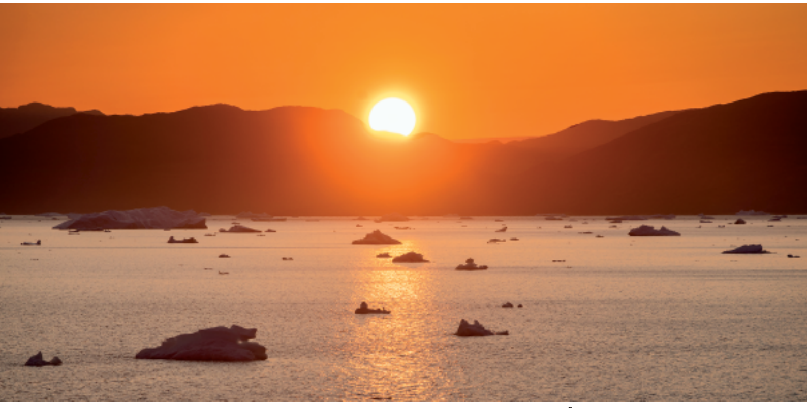
Den flotte solnedgang set ud over Narsaq Sund med isfjelde på fjorden

Vi var atter på vej retur mod hotellet, og en endnu en skøn dag fyldt med oplevelser, var ved at slutte - i morgen ventes flere.