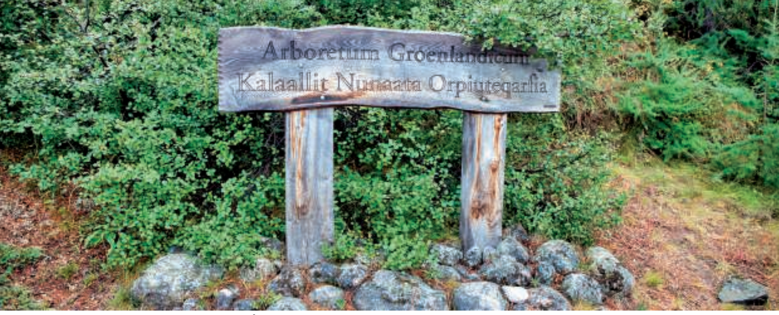
Der blev også tid til at besøge Narsarsuaq Arboret (forstbotanisk have)

Da vi først skulle afhentes kl. 11:00 til havnen, havde vi lidt tid til overs. Vi kunne derfor aflægge et besøg i Narsarsuaq Arboret (forstbotanisk have). I Narsarsuaq begyndte man i 1976 at plante nogle hårdføre træarter. Disse kom hovedsagelig fra Rocky Mountains i USA. Det blev senere fulgt op med yderligere beplantning med træarter ra arktiske egne (særligt grantræer). Narsarsuaq Arboret blev indviet i august 2004 og omfatter ca. 150 hektarer med ca. 110 forskellige træarter.