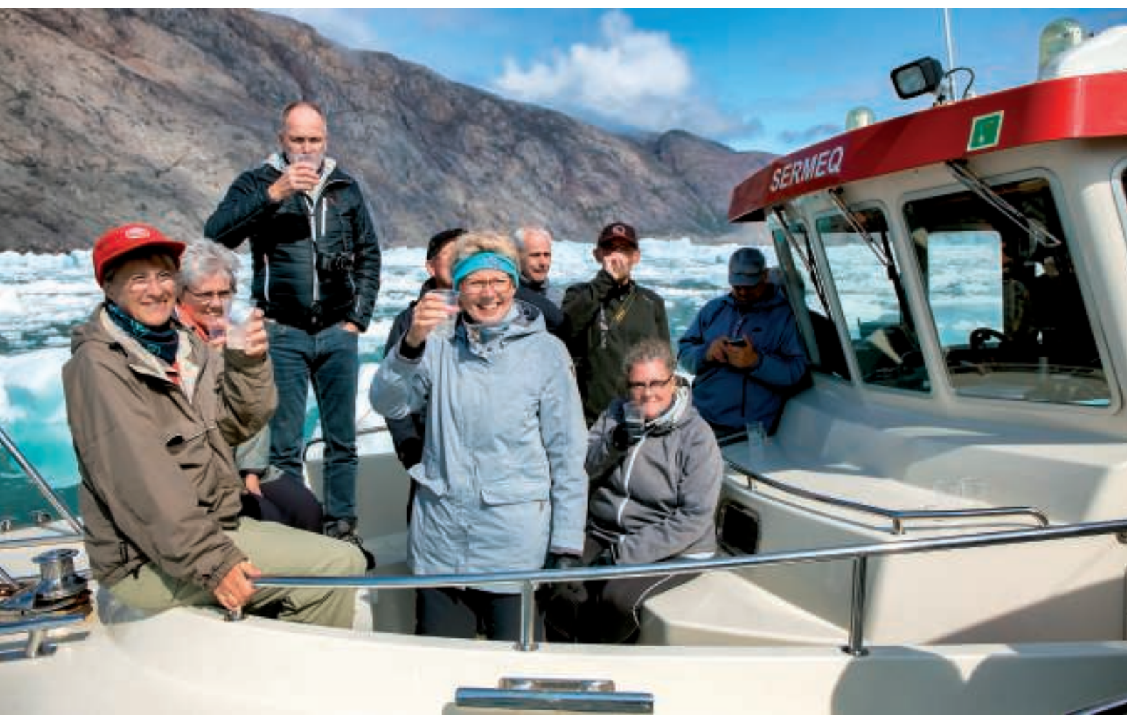
Der skåles med tusind årig gammel gletsjeris i drinksene

Klar himmel, solskin, vindstille og omgivet af is – hvad mere kan man forlange? Der blev fotograferet, og jeg havde også tid til at få dronen i luften og fik taget en video og billeder af bådene og bræen.