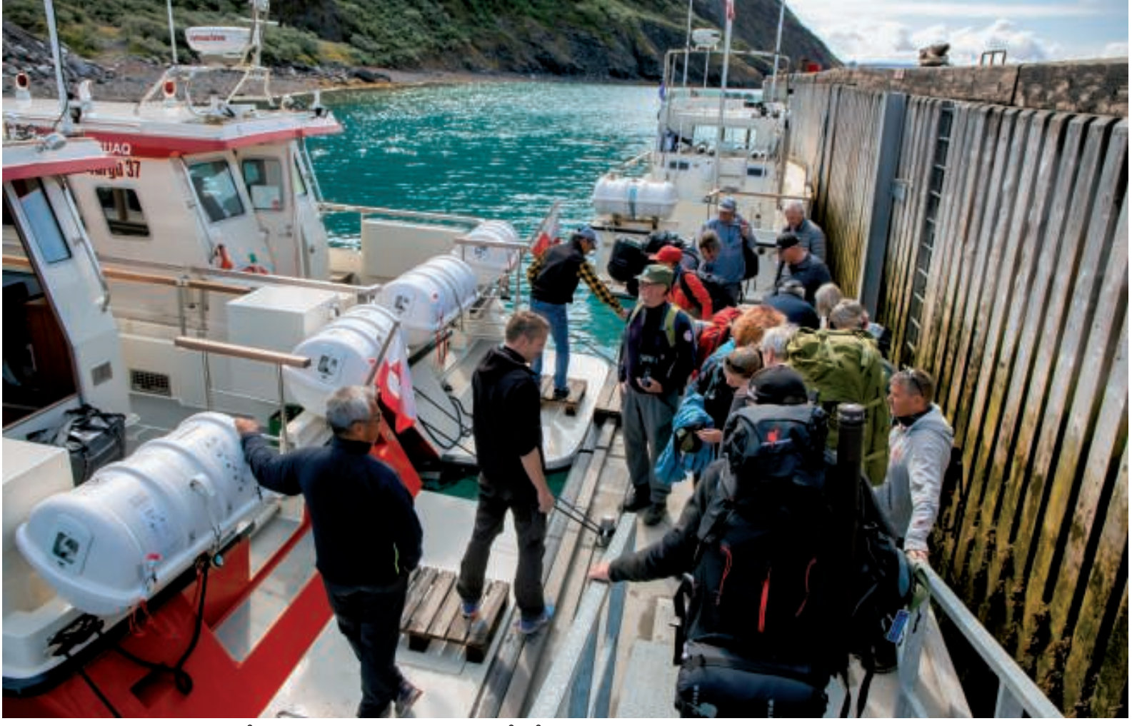
Bådene er klar. Der er trængt på bådebroen, mens bagagen bringes ombord

Bagagen kom ombord, humøret var højt, og snart efter var vi på vej i fuld fart (+30 knob).