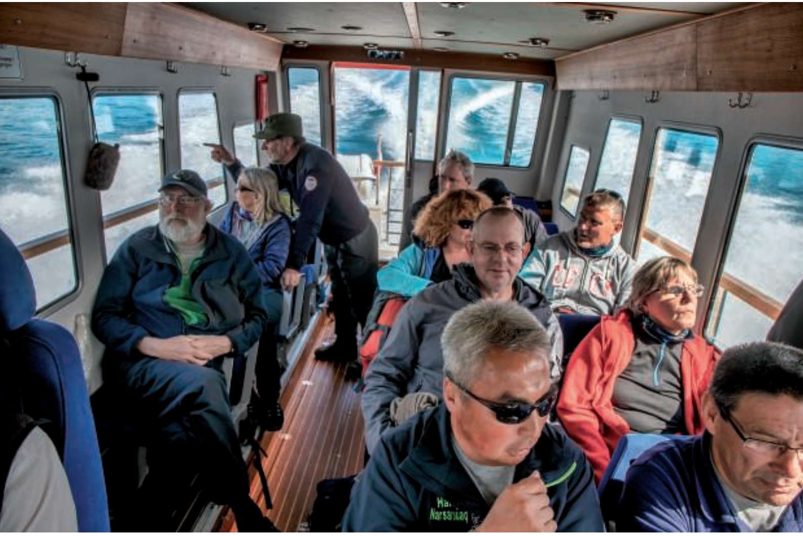
Der var god plads om læ (indenbords) under sejladsen mod Narsaq

Vi passerede under de højspændingsledninger, som forsyner Narsaq med strøm fra et vandkraftværk liggende længere væk. Snart efter så vi Narsaq, og bådene styrede mod landgangsbroen.