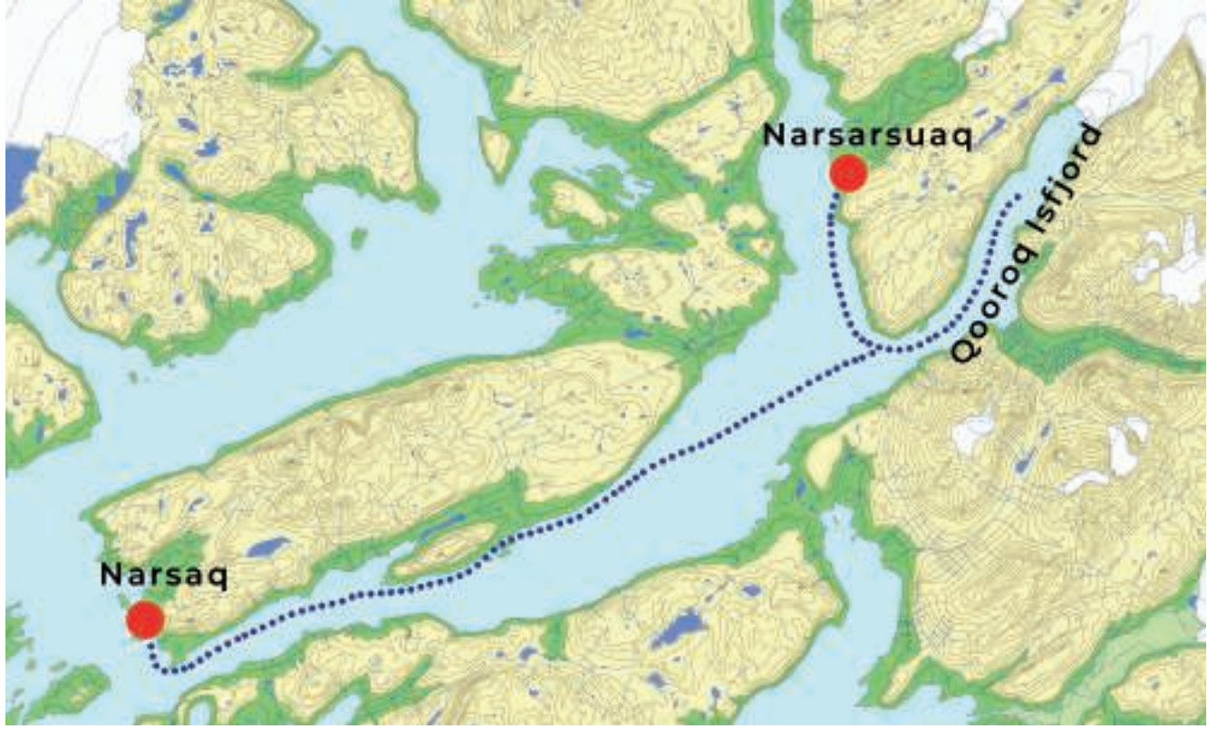
Kort over dagens tur – fra Narsarsuaq til Narsaq via Qooroq Isfjord

I dag skulle vi på en sejltur fra Narsarsuaq Havn til Qooroq Isfjord, hvor der ville være en flot udsigt over fjord og isbræ. Derefter skulle turen gå videre mod Narsaq, hvor vi skulle indkvarteres på Hotel Narsaq.