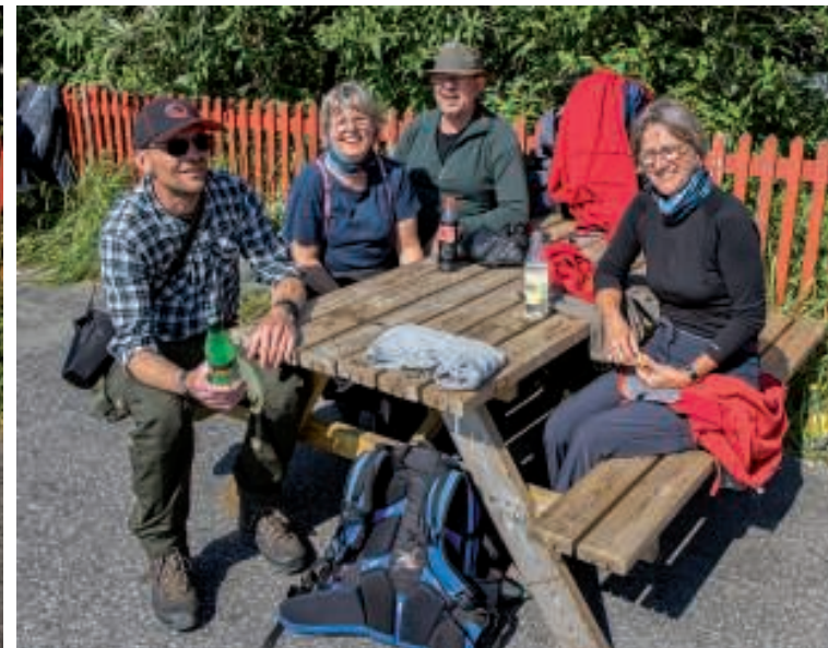
Det gode vejr nydes i fulde drag