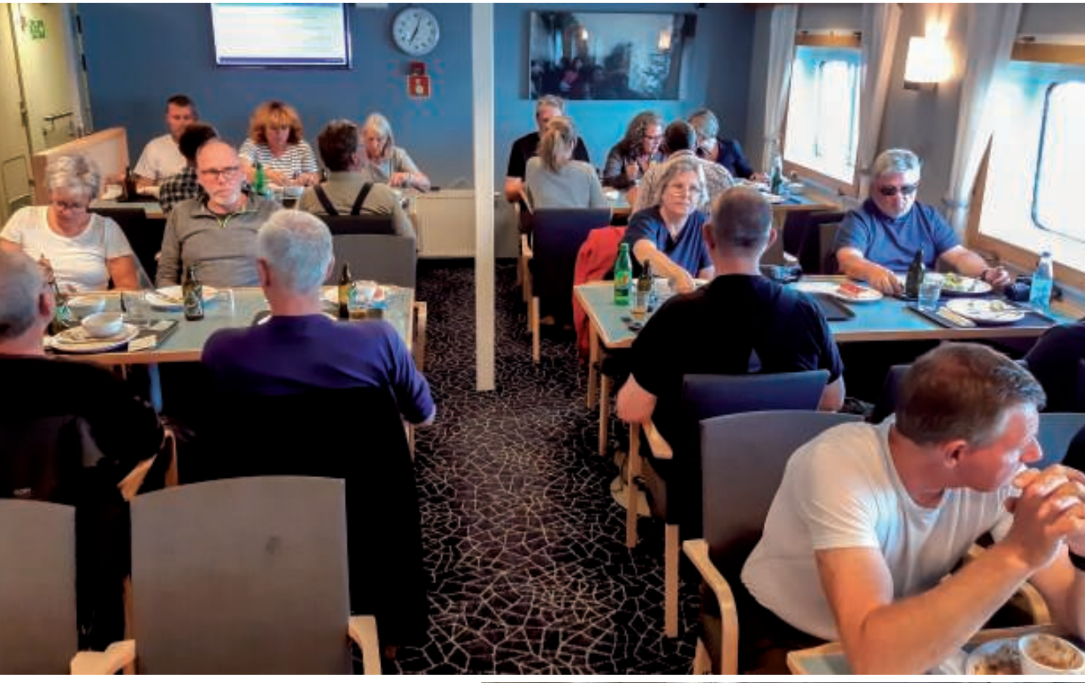
Så er det tid til aftensmad

Vi kom godt ombord på kystskibet og fandt hurtigt vore kupéer. Det tog lidt tid at få al bagage og proviant opmagasineret, men inden længe var vi på dækket for at se afsejlingen og tage afsked med Qaqortoq.