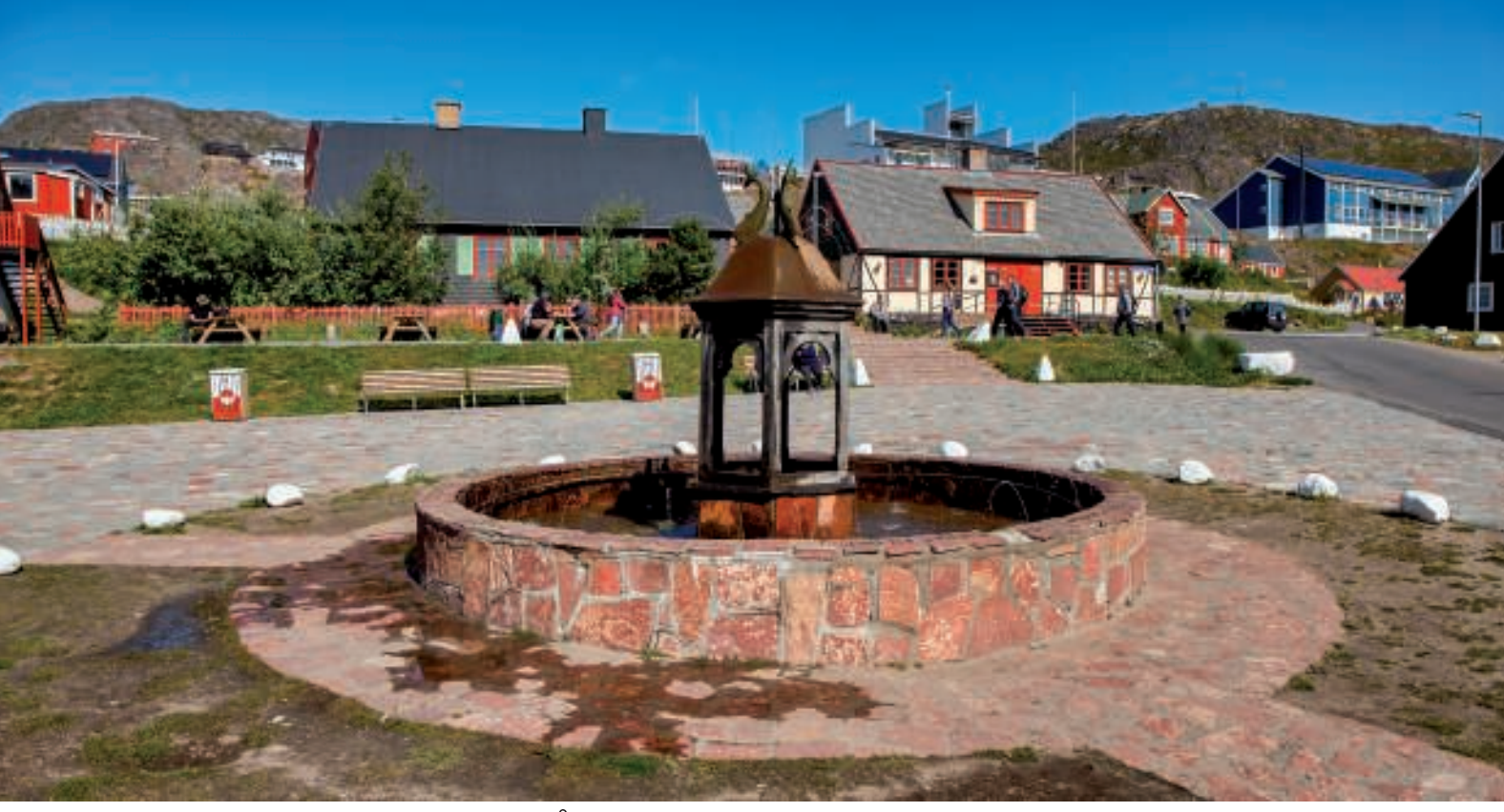
Springvandet på torvet. Grønlands eneste udendørs springvand Den smukke gamle kirke - Frelserens Kirke

I Qaqortoq centrum findes også Grønlands eneste udendørs springvand (indviet i 1932) samt en smuk gammel kirke - Frelserens Kirke (opført i 1832).