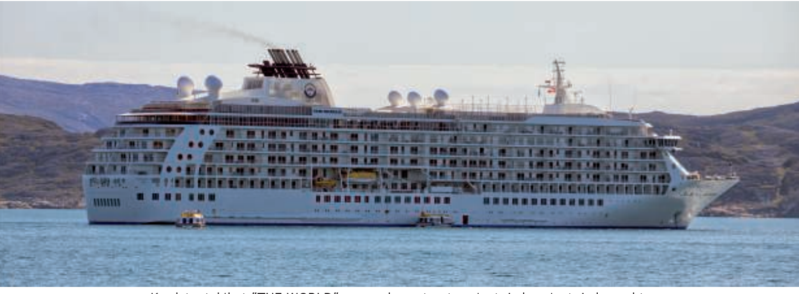
Krydstogtskibet "THE WORLD" er verdens største privatejede privatejede yacht.

Uden for havnen var et nyt krydstogtsskib "THE WORLD" ankommet, så pludselig var byen fyldt med turister.