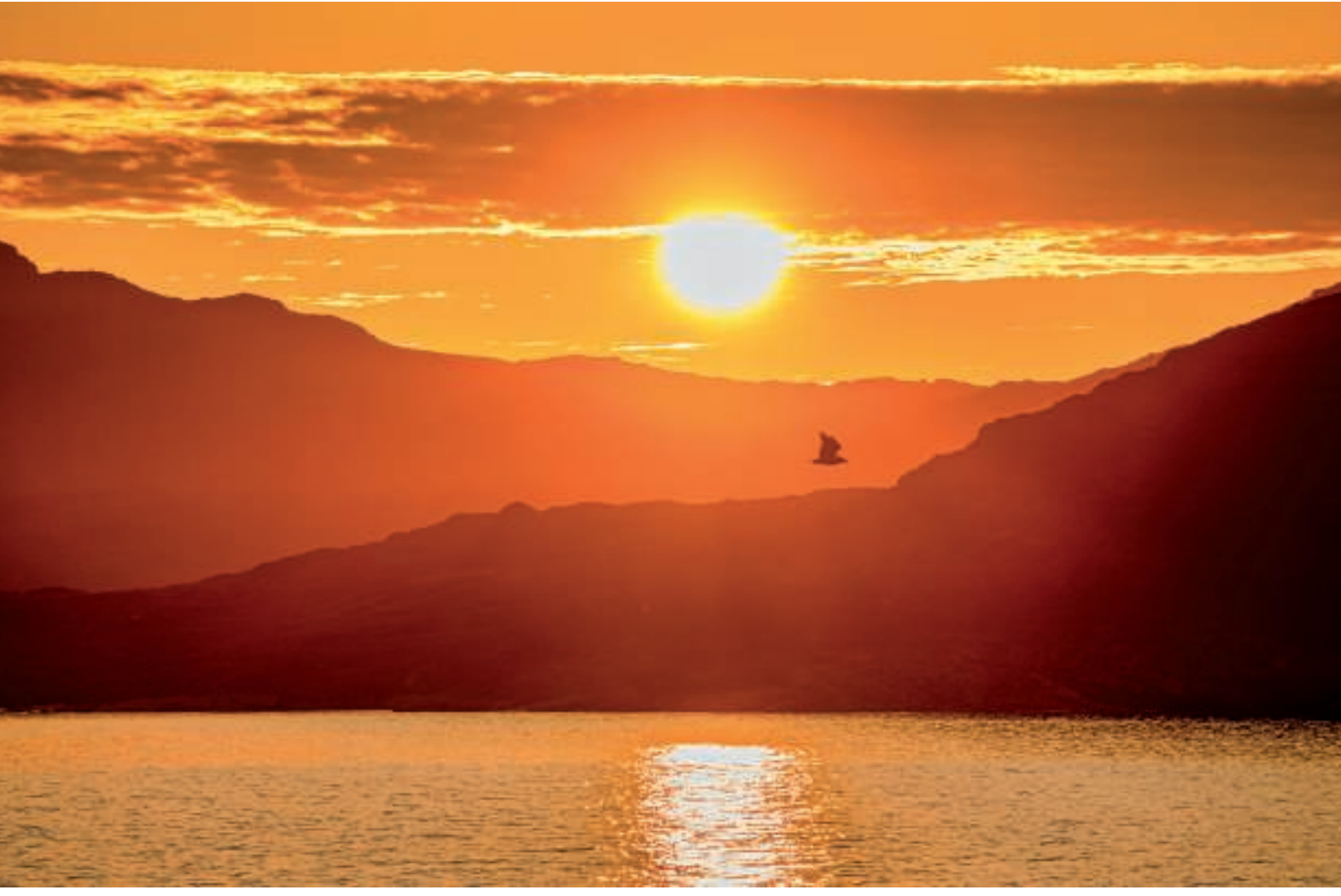
En smuk dag afsluttedes med en flot solnedgang.

I morgen ventede Arsuk og Grønnedal - rejsens hovedmål.