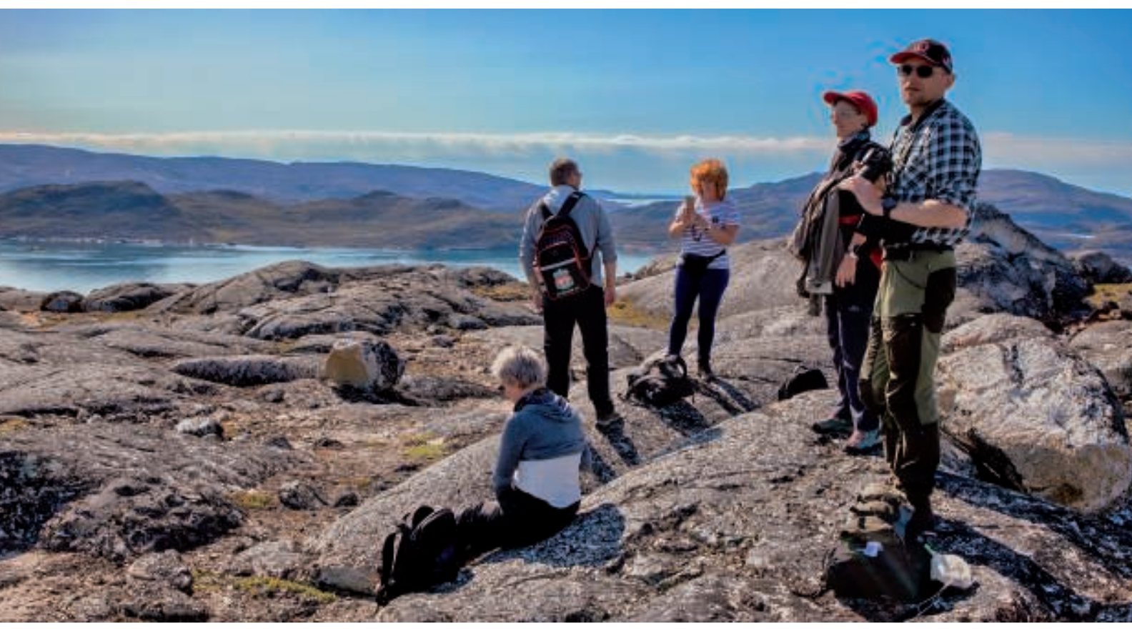
Der var tid til at nyde den fantastiske udsigt

Nogle pauser blev det også til. Under disse var der god tid til at nyde udsigten, som blev bedre og bedre, jo højere vi kom op.