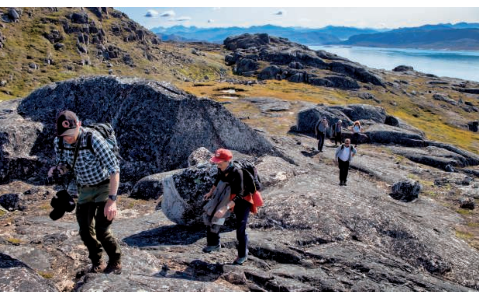
På vej op ad fjeldet

Her ved slutningen af den asfalterede vej fandt vi nogle stier, som ledte videre op og ind i fjeldet mod diverse fjeldtoppe.