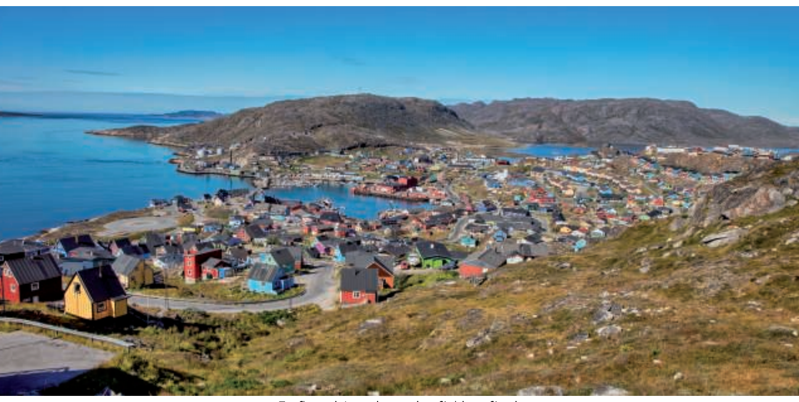
En flot udsigt ud over by, fjeld og fjord

Vi nåede snart enden af vejen, hvorfra der var en utrolig udsigt over by, fjeld og fjord.