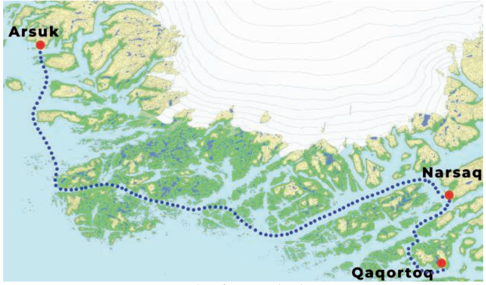
Kort over sejlruten fra Qaqortoq til Arsuk

I løbet af sejladsen ville skibet foretage et kort anløb af Narsaq for at hente og aflevere passagerer. Herfra ville skibet sejle direkte mod Arsuk med ankomst næste