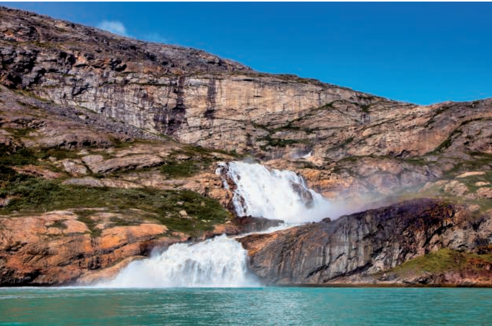
Det imponerende Fox-vandfald