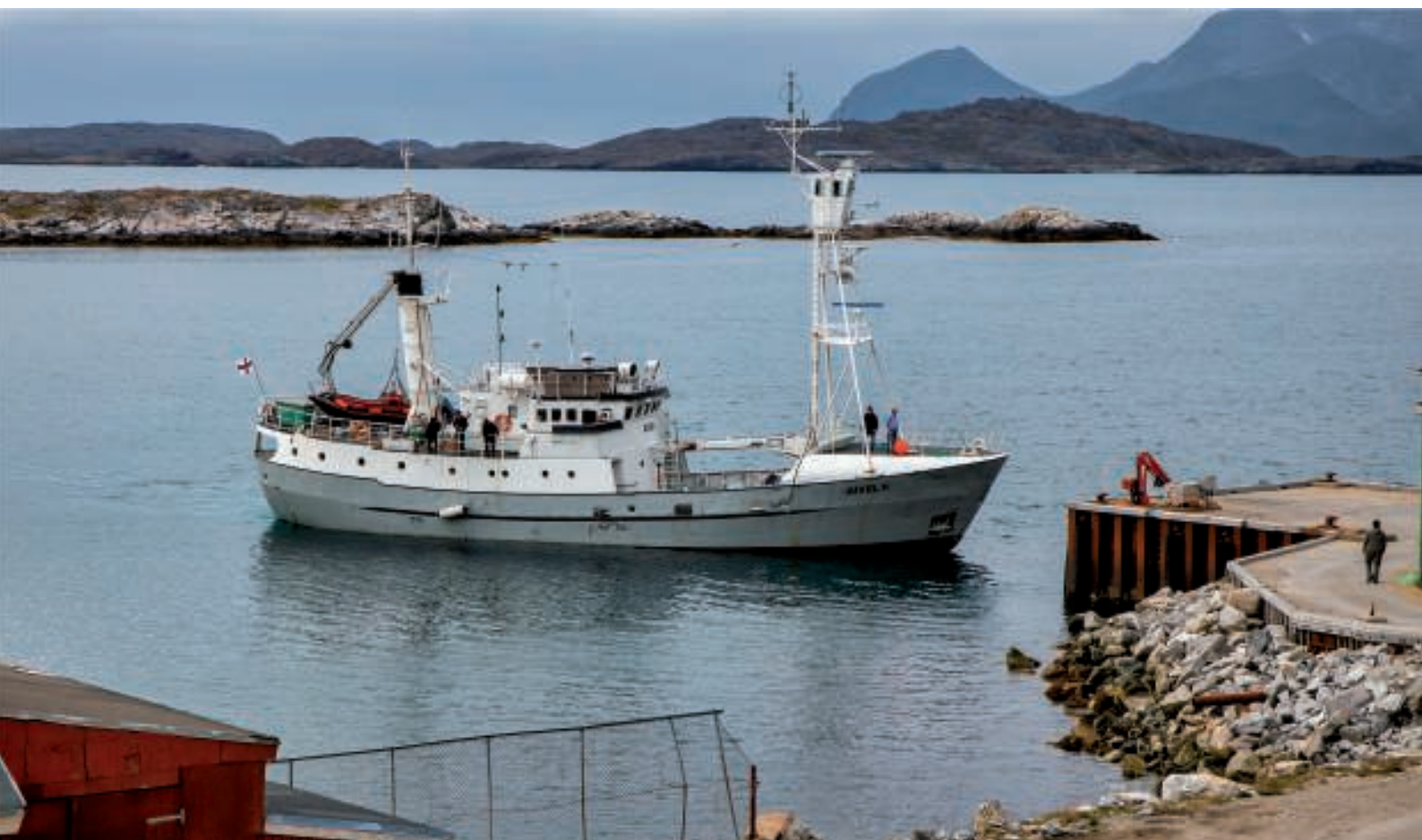
"JUVEL II" / "AGDLEK"

Ud ad vinduet så vi pludselig kutteren "JUVEL II", som var ved at lægge til kaj. "JUVEL II" er den tidligere inspektionskutter "AGDLEK", som jeg for år tilbage havde sejlet med. Der var også flere af deltagerne, som kendte den. Skibet sejlede for en færøsk indremissionsk menighed og gennemfører hvert år missionssejls langs de grønlandske kyster.