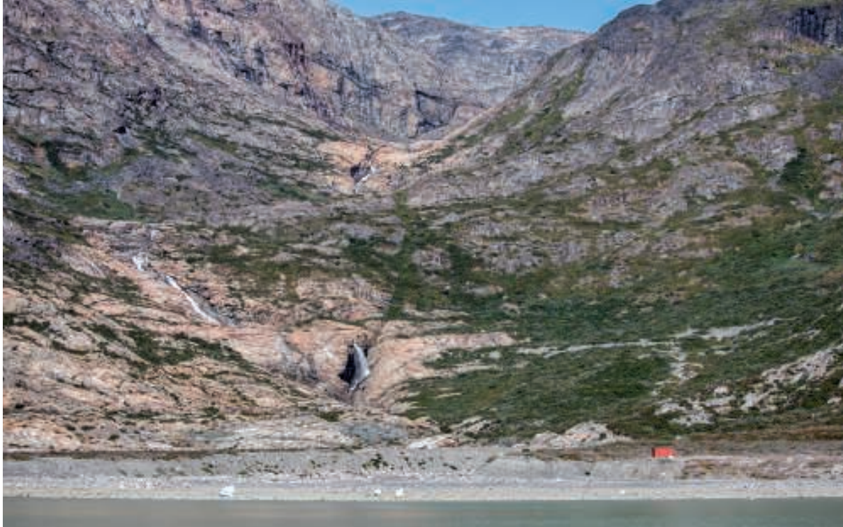
Et imponerende vandflad. "Bræ-hytten" ligger til højre i billedet

Inden vi kom frem til bræen, sejlede vi forbi "Bræ-hytten". Her findes også et imponerende vandfald. For nogle år siden kom der så meget smeltevand fra Indlandsisen, at et nyt løb blev dannet kun ganske få meter fra den røde hytte.