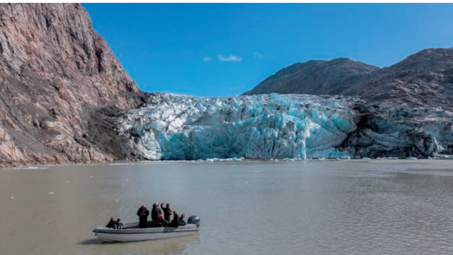
Vi ligger i behørig afstand fra bræen og nyder udsigten

Inden vi kom frem til bræen, sejlede vi forbi "Bræ-hytten". Her findes også et imponerende vandfald. For nogle år siden kom der så meget smeltevand fra Indlandsisen, at et nyt løb blev dannet kun ganske få meter fra den røde hytte.