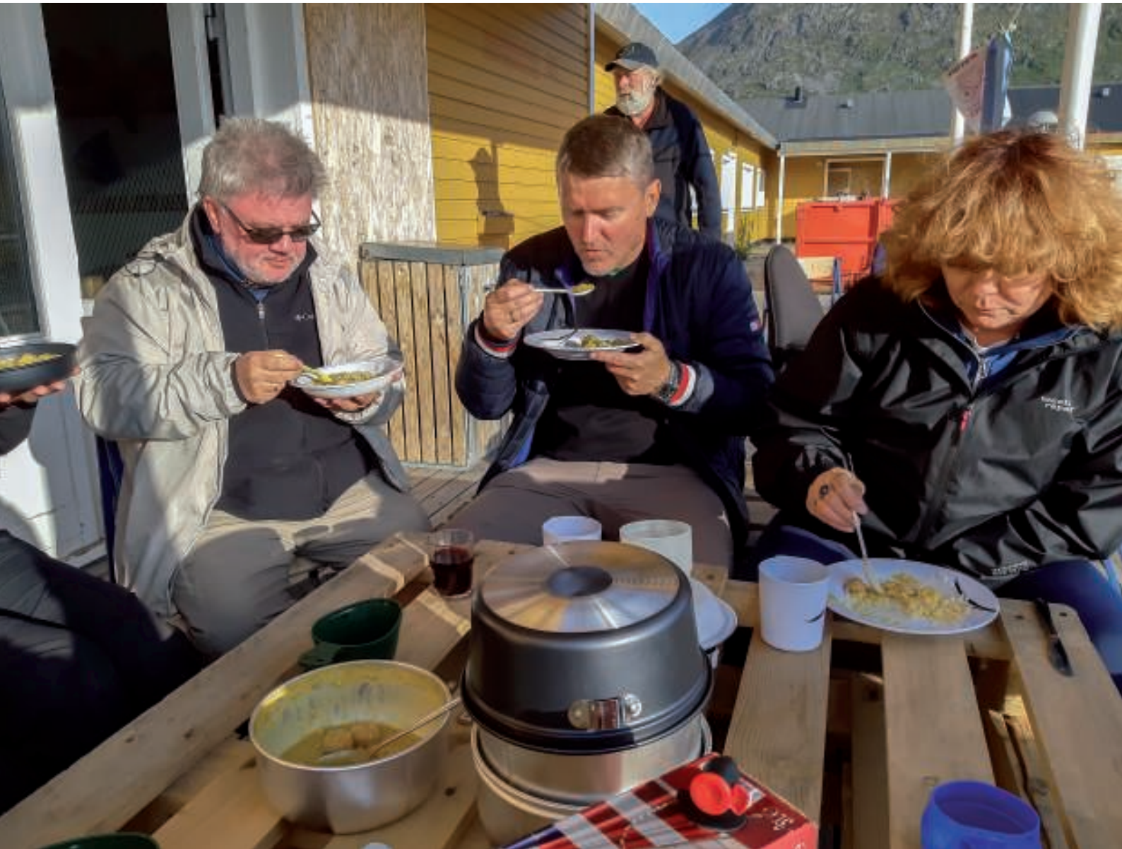
Aftensmaden nydes i det fri

Da vejrudsigten var meget lovende, og det alligevel skulle blive en dag med solskin og svage vinde, var det oplagt at tage på vandretur i fjeldet.