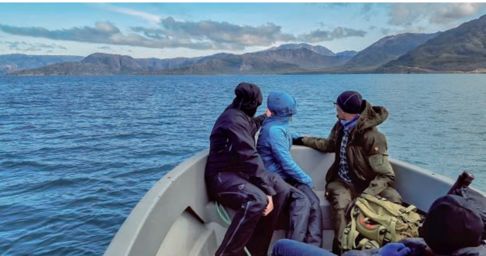
Det første syn af Grønnedal

Solen havde nu brændt tågen væk, og det blev det skønneste vejr. Vi lagde til i Grønnedal ved bådebroen. Da vejret var blevet så skønt, aftalte vi med Knud, at han ville komme retur kl. 13:30 og gennemføre en sejlads til Fox-faldet og Isbræen.