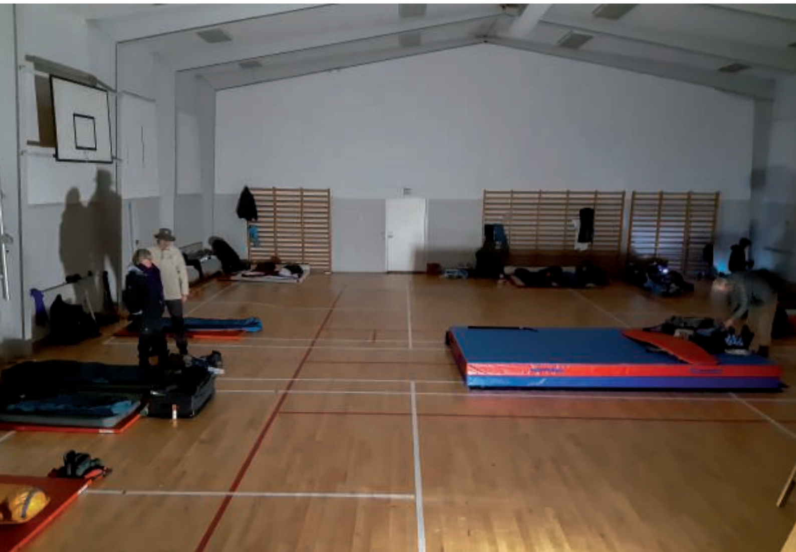
Gymnastiksalen, hvor vi var indkvarteret under opholdet i Grønnedal

Efter en lang og oplevelsesrig dag var det på tide at gå til køjs. Nu fik vi endelig brug for vores medbragte sovepose og liggeunderlag.