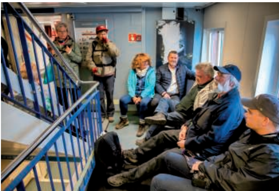
Det er tidligt, men vi er klar!

Grundet den lave vanddybde ved kajen kunne skibet ikke gå til kaj. For at komme i/fra land anvendtes skibets MOB-båd (Mand Over Bord). Den blev hejst ud over siden og klargjort. Der kunne være 7-8 personer på hver tur, hvorfor vi opdeltes i tre hold. Samtidig fik vi udleveret en redningsvest, som skulle bæres under sejladsen fra skib til land.