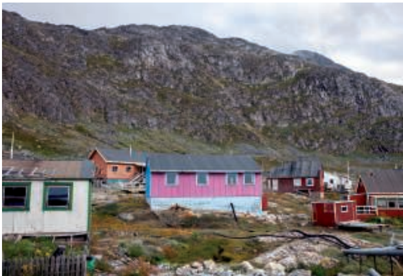
Det "lilla" hus

Da vi allerede skulle videre samme dag og på returrejsen kun skulle have to overnatninger, gik det lige an for 14 personer at bo der!