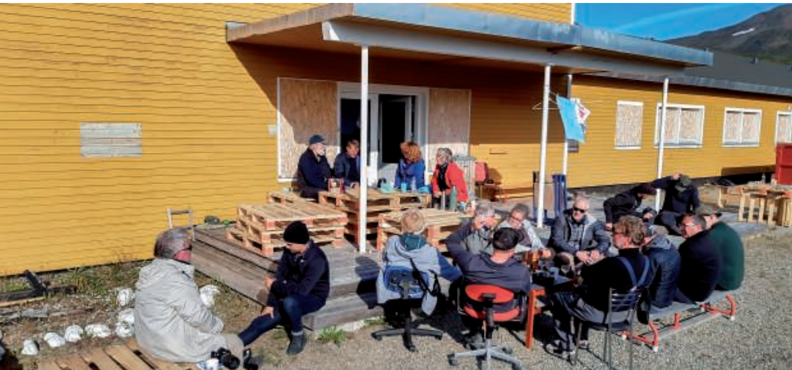
Det gode vejr nydes

Da vi kom frem til gymnastiksalen, havde de øvrige allerede stillet paller op, nød vejret og fik sig en kop kaffe. Vi berettede om vores fantastiske tur til bræen og om hvalen, som vi havde set.