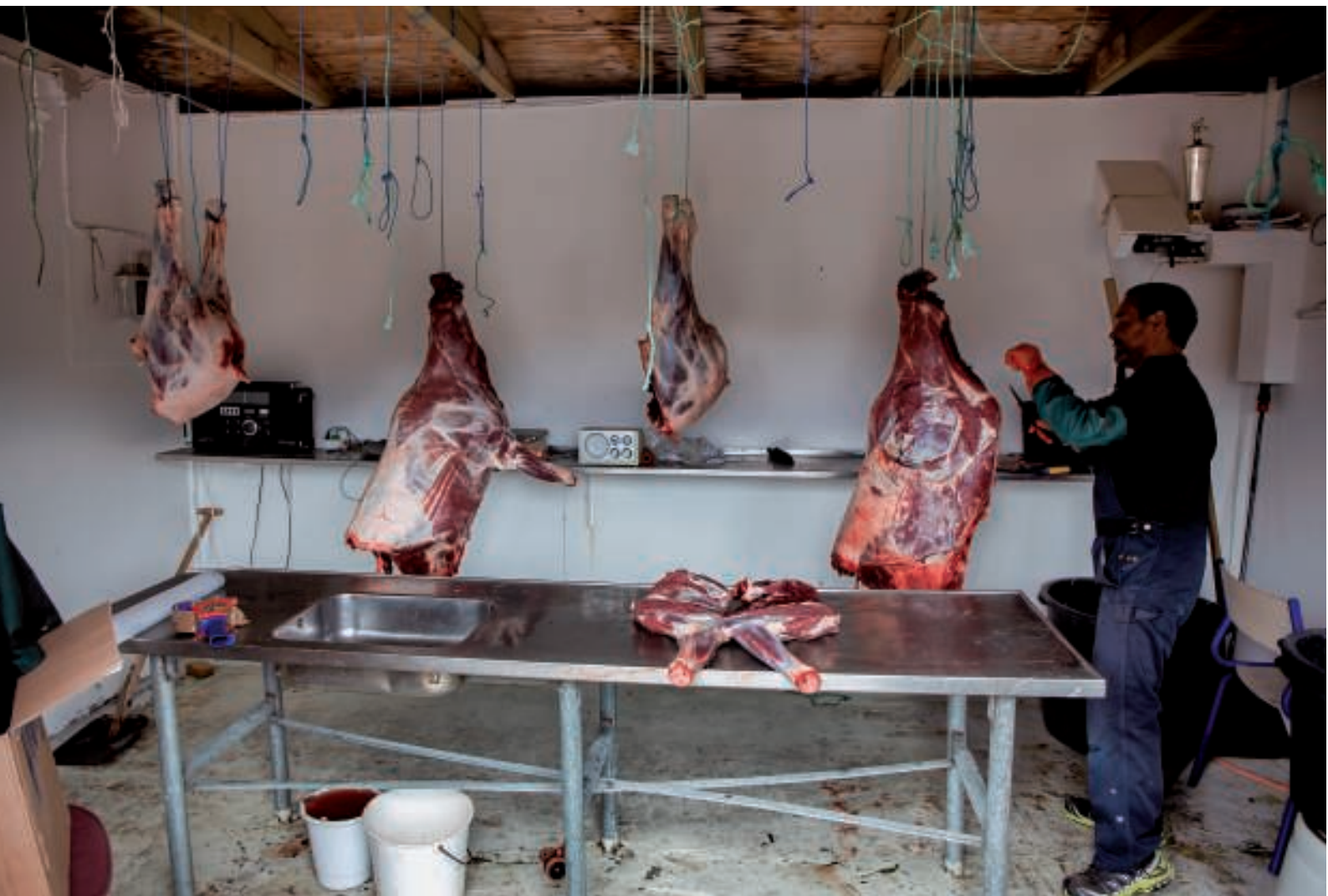
To moskusokser var parteret og ved at blive hængt op

Vi købte nogle citron- og hindbær sodavand (det var udbuddet!) - og det var det!