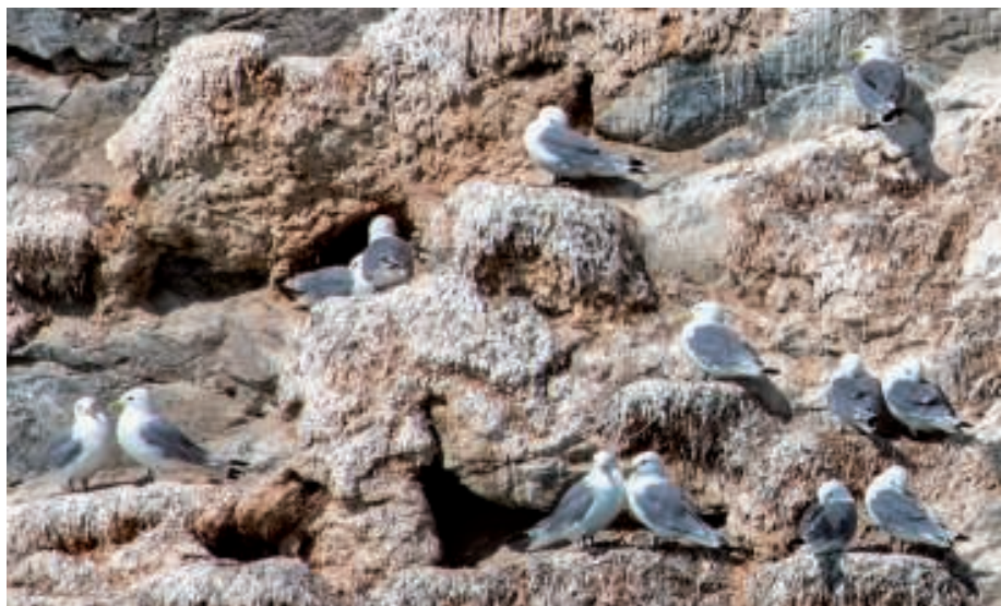
En lille del af Fuglefjeldet

På behørig afstand af fuglefjeldet blev farten sat op, og nu gik det i fuld fart ind mod Arsuk Isbræ. Den kunne ses på lang afstand, og det kunne konstateres, at bræen på bare få år havde trukket sig meget tilbage.