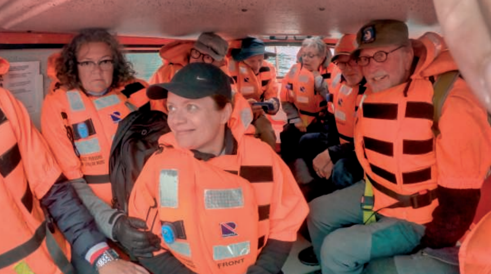
Med syv personer i MOB-båden var båden fyldt godt op

Båden blev fyldt op, og snart var første hold på vej mod Arsuk. Efter tre ture var alle kommet sikkert i land.