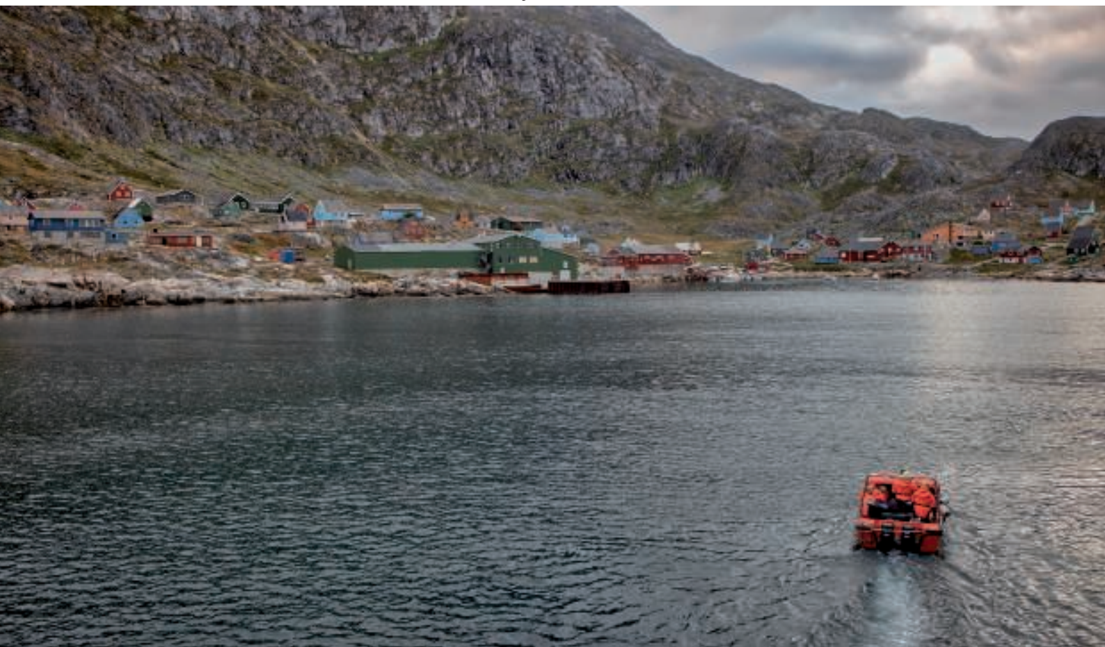
På vej mod Arsuk

Båden blev fyldt op, og snart var første hold på vej mod Arsuk. Efter tre ture var alle kommet sikkert i land.