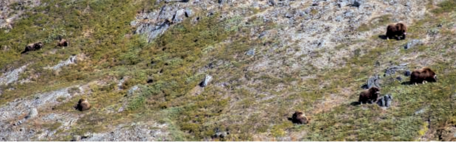
Moskusokserne som vi så på behørig afstand

Efter en god frokost var vi atter på vej. Terrænet ændrede karakter, og vi måtte passere flere strækninger, som bragte os enten opad eller nedad. Afstandene var heldigvis ikke ret lange, men forholdsvis stejle.