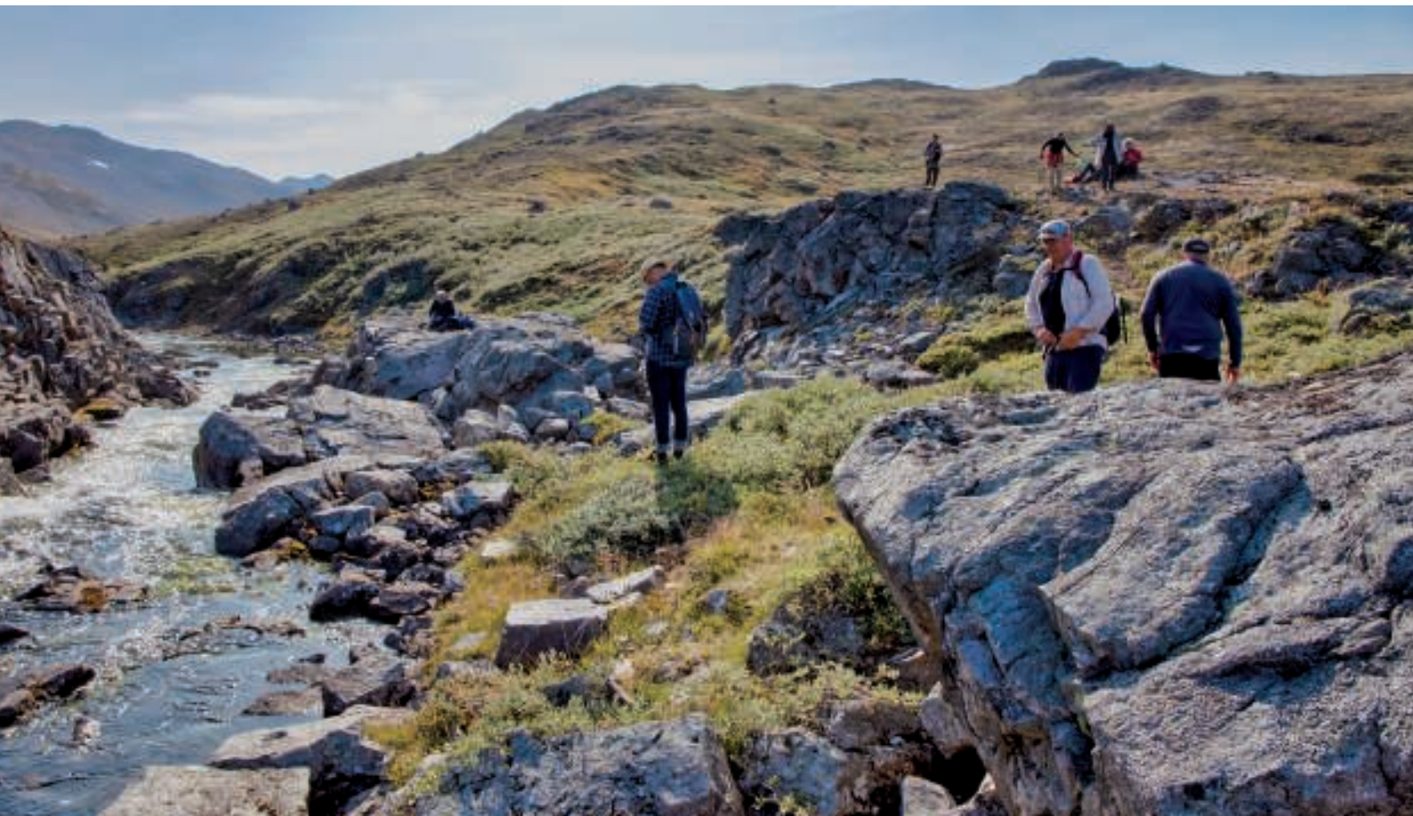
Ved Bryggerens Elvs begyndelse. Udsigten nydes mens vandflaskerne fyldes

Vi fulgte nu fjeldkammen med Langesø på den ene side og Grønnedalen på den anden. Snart var vi nede ved Langesø, og der gik ikke lang tid, inden vi nød det skønne vand og fik fyldt drikkeflaskerne.