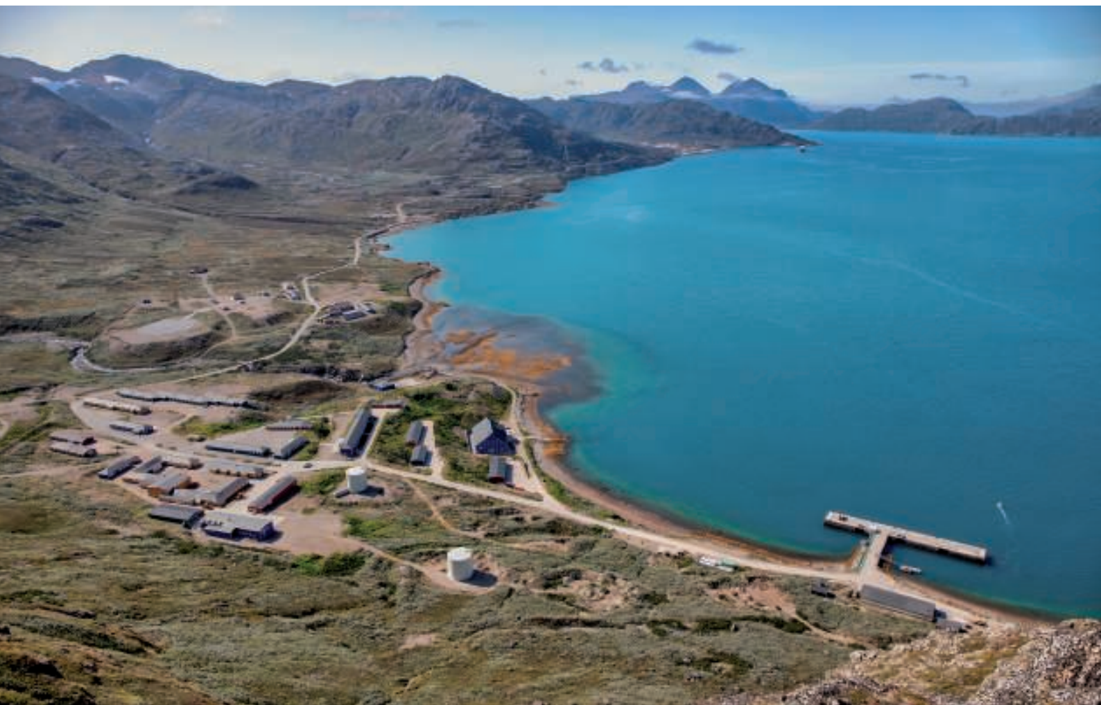
Udsigten ud over Grønnedal og Arsukfjorden nydes og foreviges

Kort herfra fandtes en platform, hvorfra man kunne skue ud over Grønnedal og Arsukfjorden. Kameraerne blev atter fundet frem, og dette formidable syn blev foreviget af flere.