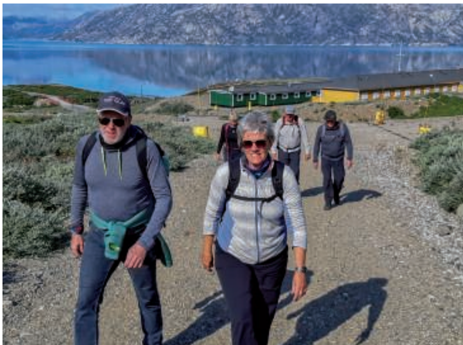
På vej ud af vejen ind i Grønnedalen

Ved den nedlagte skilift drejede vi af og fortsatte langs et spor i terrænet.