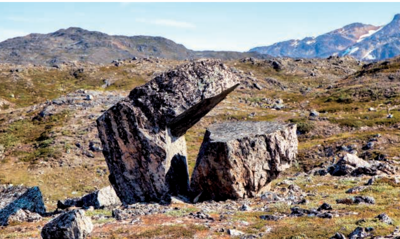
”Den gabende sten”

Nu var der kun en kortere vandring, inden vi kom frem til turens næste mål – ”den gabende sten”. Her fandtes mange sten i forskellige størrelser og former - nogle med form efter noget genkendeligt, hvorfor det er forholdsvis nemt at forstå grunden til, at denne har fået sit særlige navn.