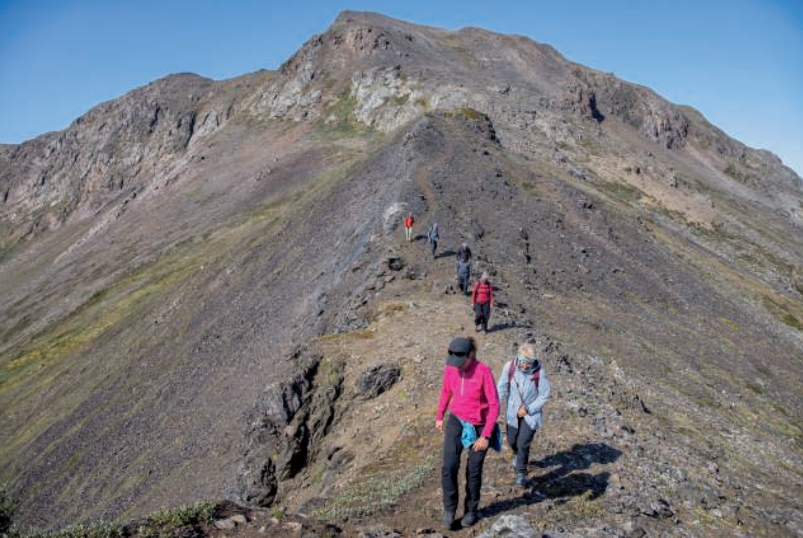
Vi går langs kammen med toppen i baggrunden

Vi fulgte nu fjeldkammen med Langesø på den ene side og Grønnedalen på den anden. Snart var vi nede ved Langesø, og der gik ikke lang tid, inden vi nød det skønne vand og fik fyldt drikkeflaskerne.