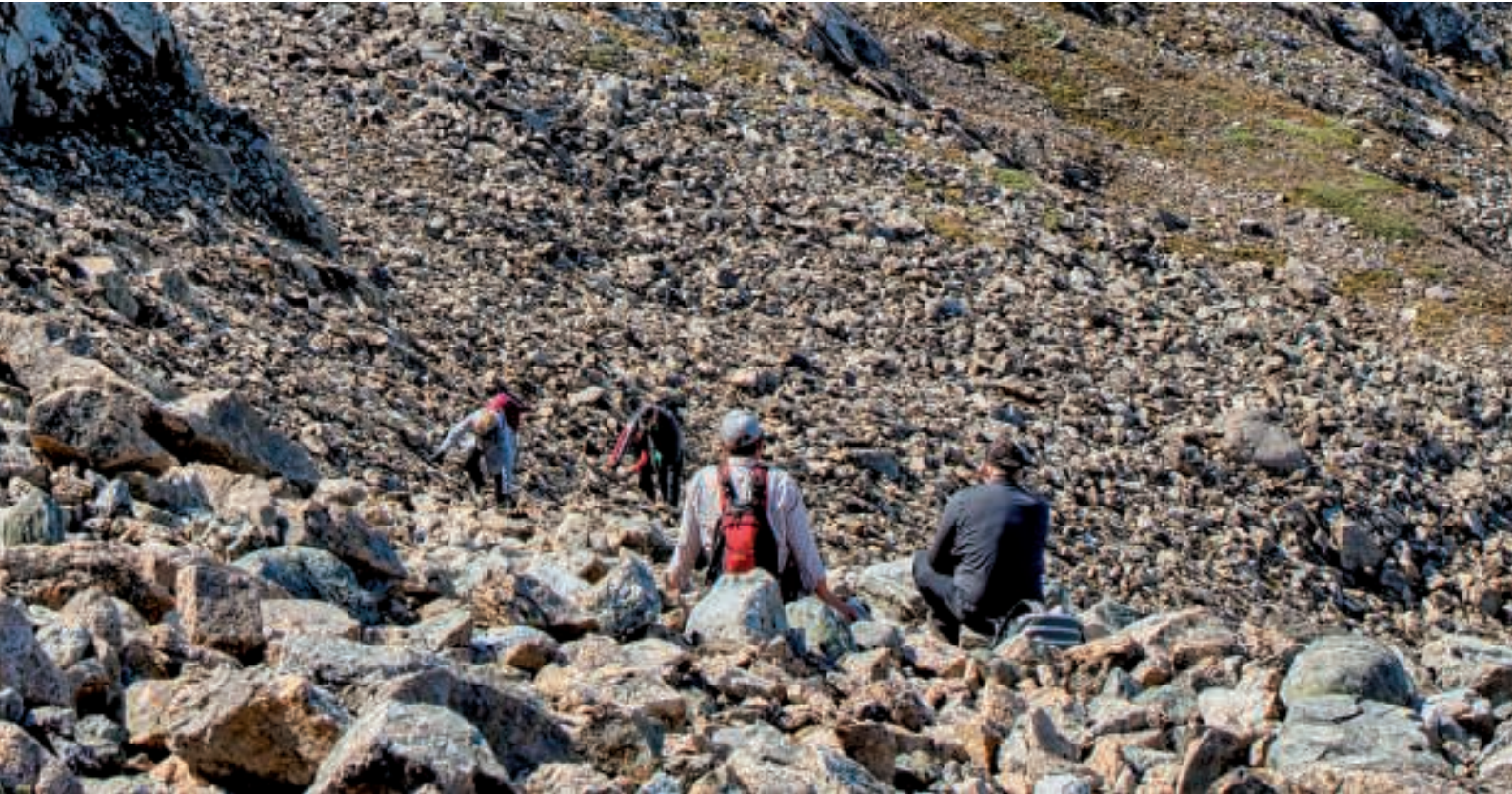
Det forholdsvis stejle stykke med sten forceres

Efter stenene var forceret, var resten af turen mod toppen rimelig let