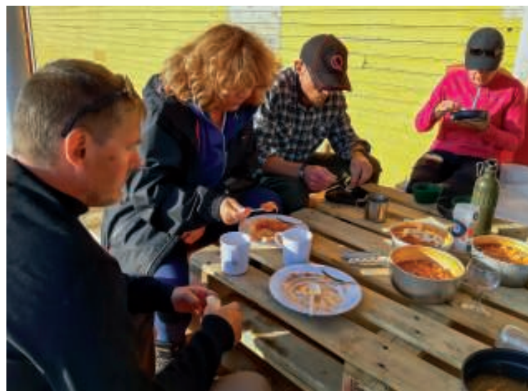
Maden nydes med største velbehag

Vejrudsigten for lørdag lovede overskyet vejr med mulighed for regn om eftermiddagen.