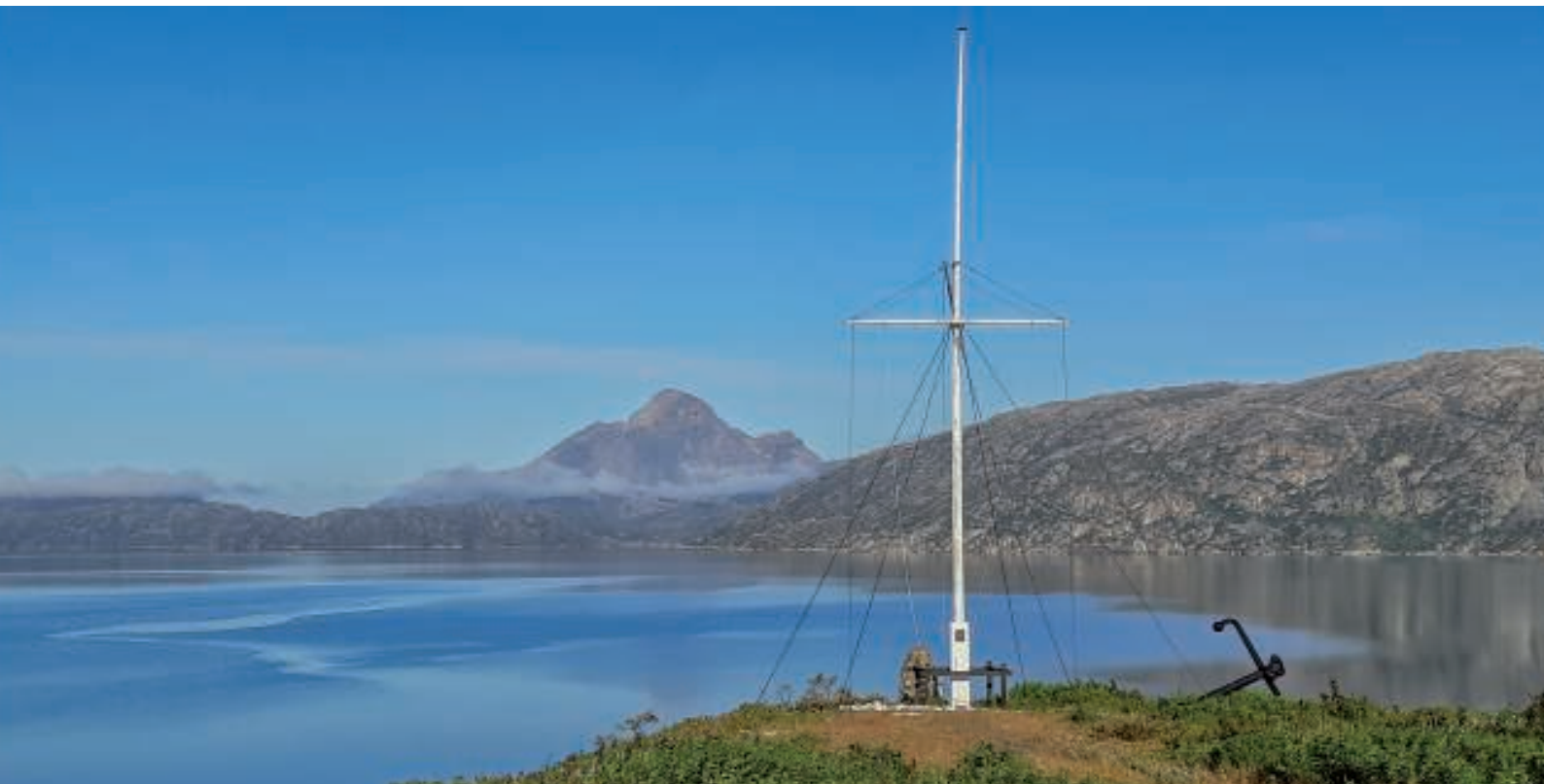
Flagbastionen med Kûngnâit-fjeldet i baggrunden. Et kendt motiv for mange

Efter endnu en god nats søvn ventede nye oplevelser. Vejret viste sig atter fra sin pæneste side med blå himmel, solskin og svag vind. Jeg havde sovet fantastisk, mens andre syntes, at det havde været en kold nat. Jeg brugte tiden inden morgenmaden på at gå lidt rundt i Grønnedal og nyde stilheden. Kugnait og flagbastionen viste sig igen fra den fotogene side.