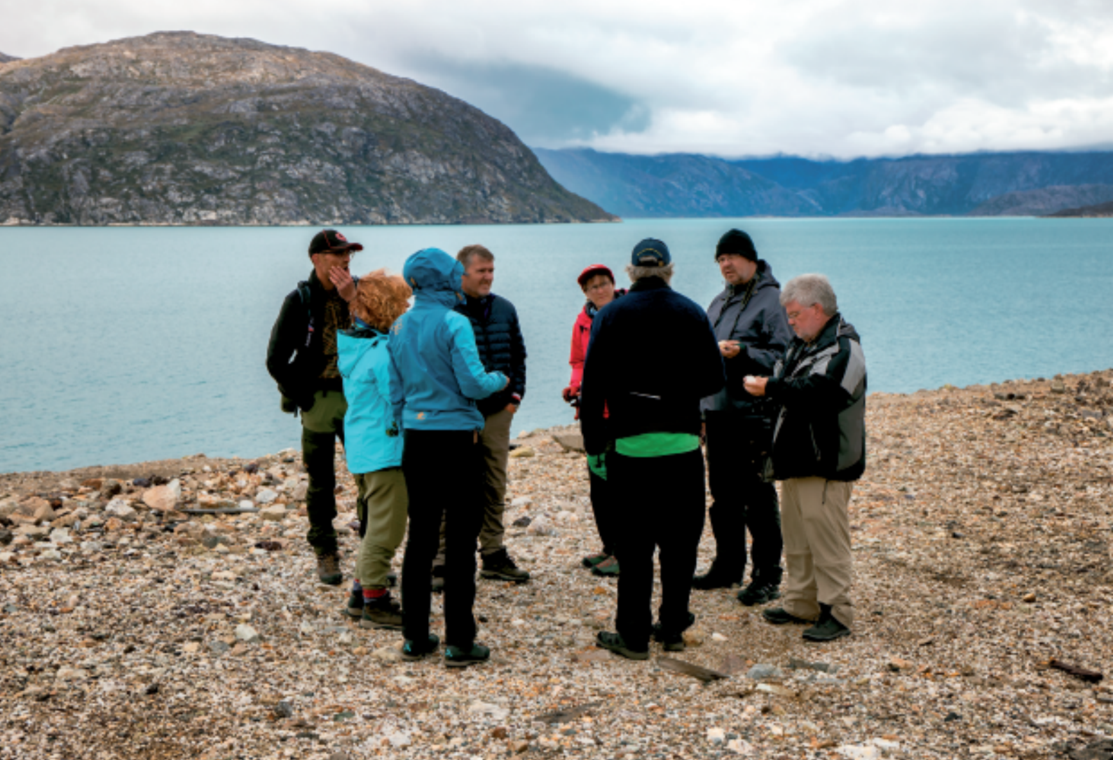
Der kikkes på og samles sten

Inden turen rundt i Ivittuut sluttede, kunne man gå på sightseeing på egen hånd, ligesom der blev brugt lidt tid på at se på de mange forskellige sten, som ligger brudt ud over et stort område. Der blev også indsamlet nogle stykker.