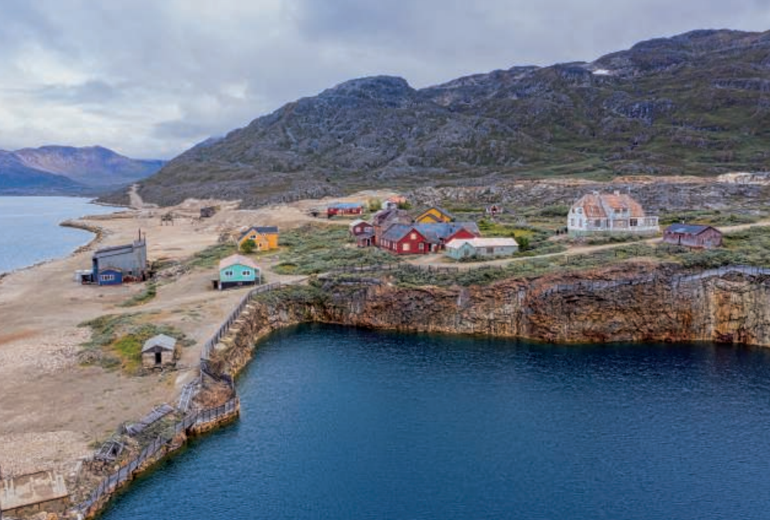
Ivittuut set fra "Hullet"