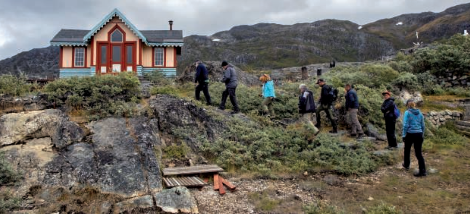
På vej til "Det Norske Lysthus"