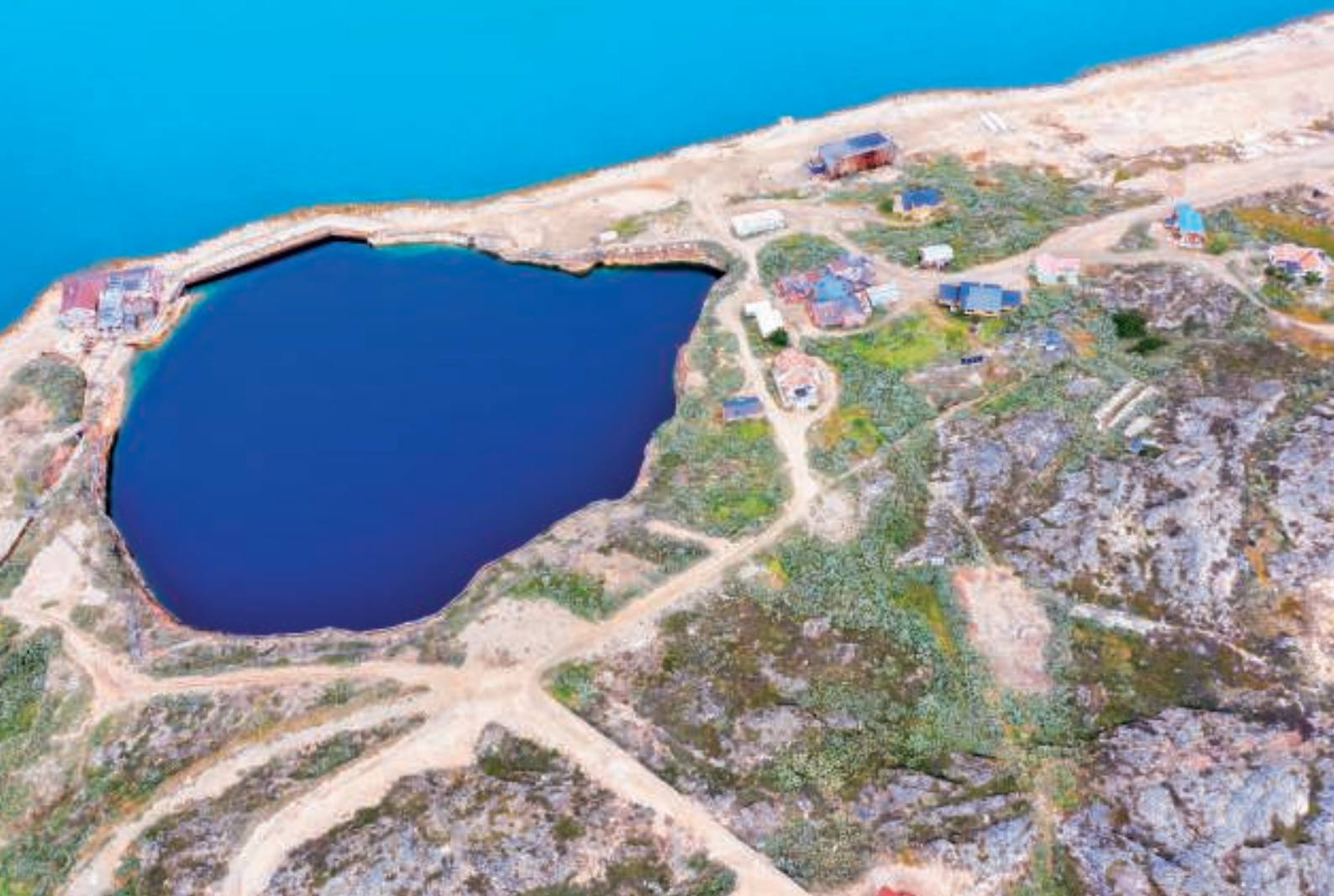
Ivittuut set fra oven

Ivittuut. Den gule bygning til højre er "Sygehuset", som senere blev til "Hotellet"