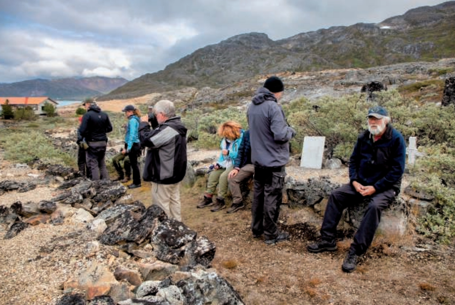
Et besøg på kirkegården. Mange omkom desværre i en ung alder