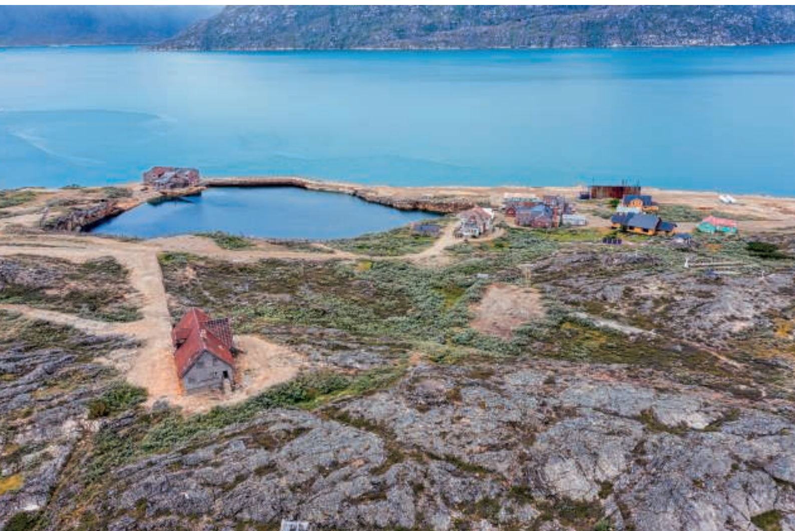
Ivittuut set ud mod havet. I forgrunden ligger "Kontrollørboligen"