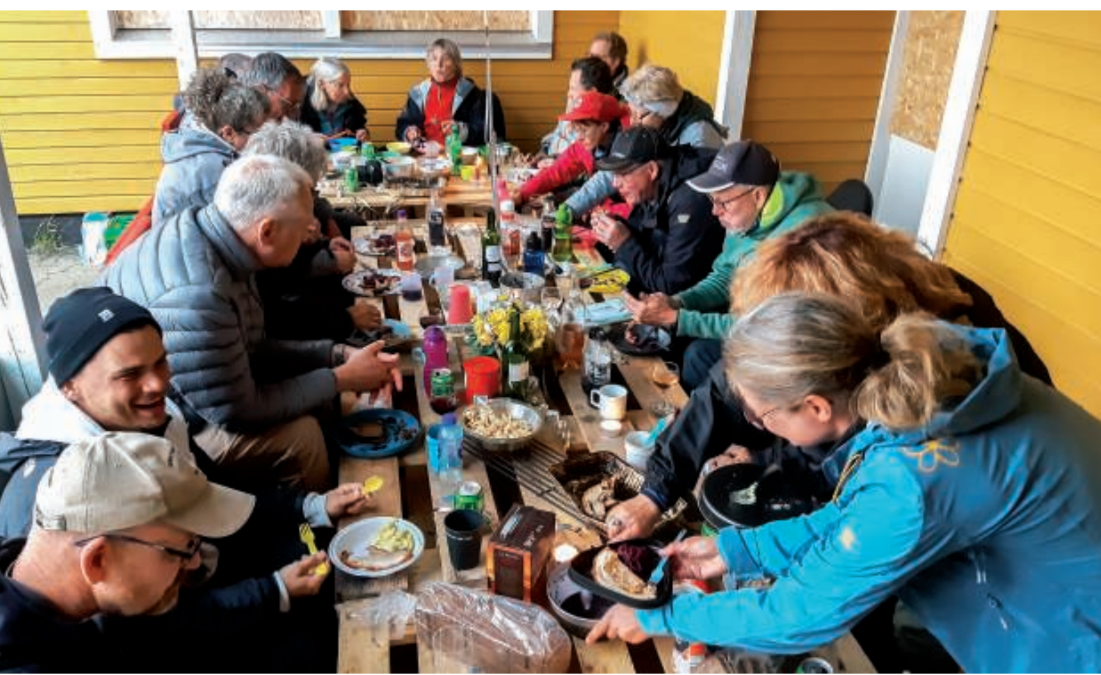
Aftensmad for sidste gang i Grønnedal. Kamstegene smagte fantastisk!

Det var tydeligt, at alle efterhånden var blevet fyldt med mange fantastiske oplevelser. På den anden side var det også vemodigt at skulle tage afsked med dette skønne sted.