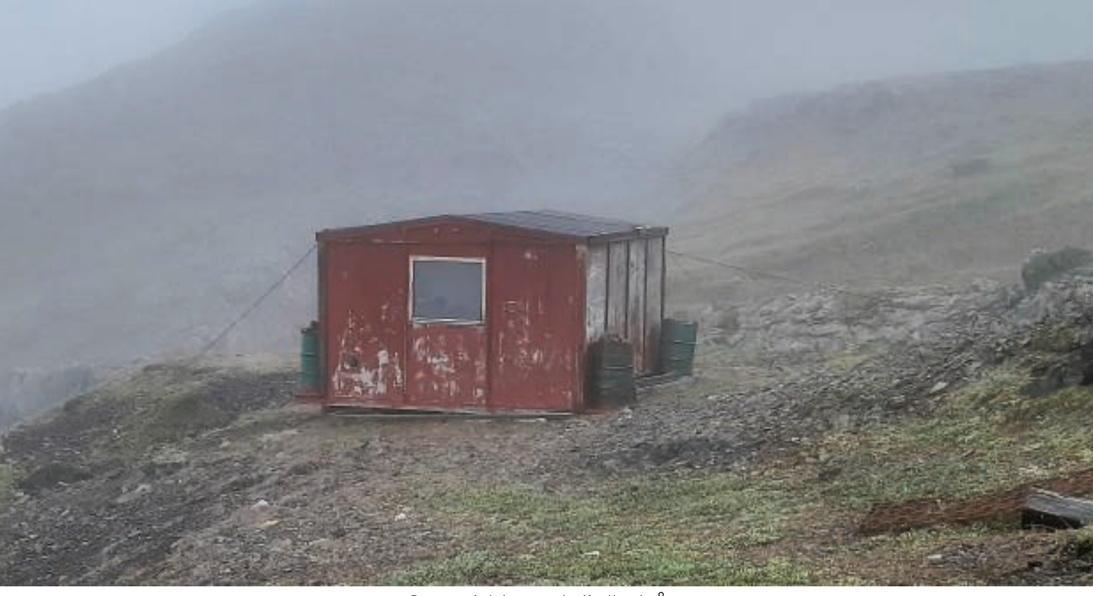
Grønnedalshytten indhyllet i tåge

Efter halvanden times vandring stod vi foran Grønnedalshytten. Det blev til et besøg og et hvil. Der var ingen hyttebog, men der var en seddel, hvorpå der stod, at nogle fangere fra Arsuk havde været forbi på moskusokse- og rensdyrjagt.