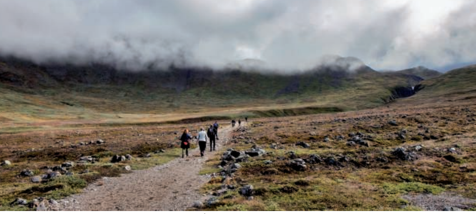
På vej op langs vejen

Vi fulgte grusvejen ud mod Grønnedalen - forbi bunkerne, og snart stod vi ved broen over Bryggerens Elv. Herfra fortsatte vi ad vejen/stien mod Grønnedalshytten. For mange år siden kunne man køre ad denne vej op mod hytten og videre om bag fjeldene, da der her var placeret radiomaster. Grundet manglende vedligehold er kørsel ikke længere mulig.