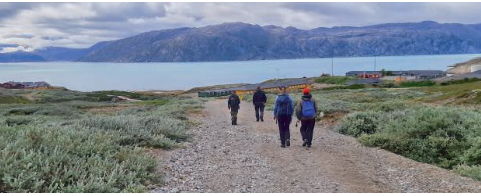
Så kom Grønnedal til syne

Efter et kort ophold fortsatte vi turen ned mod Grønnedal. Vi nåede grusvejen, og Grønnedal kom til syne.