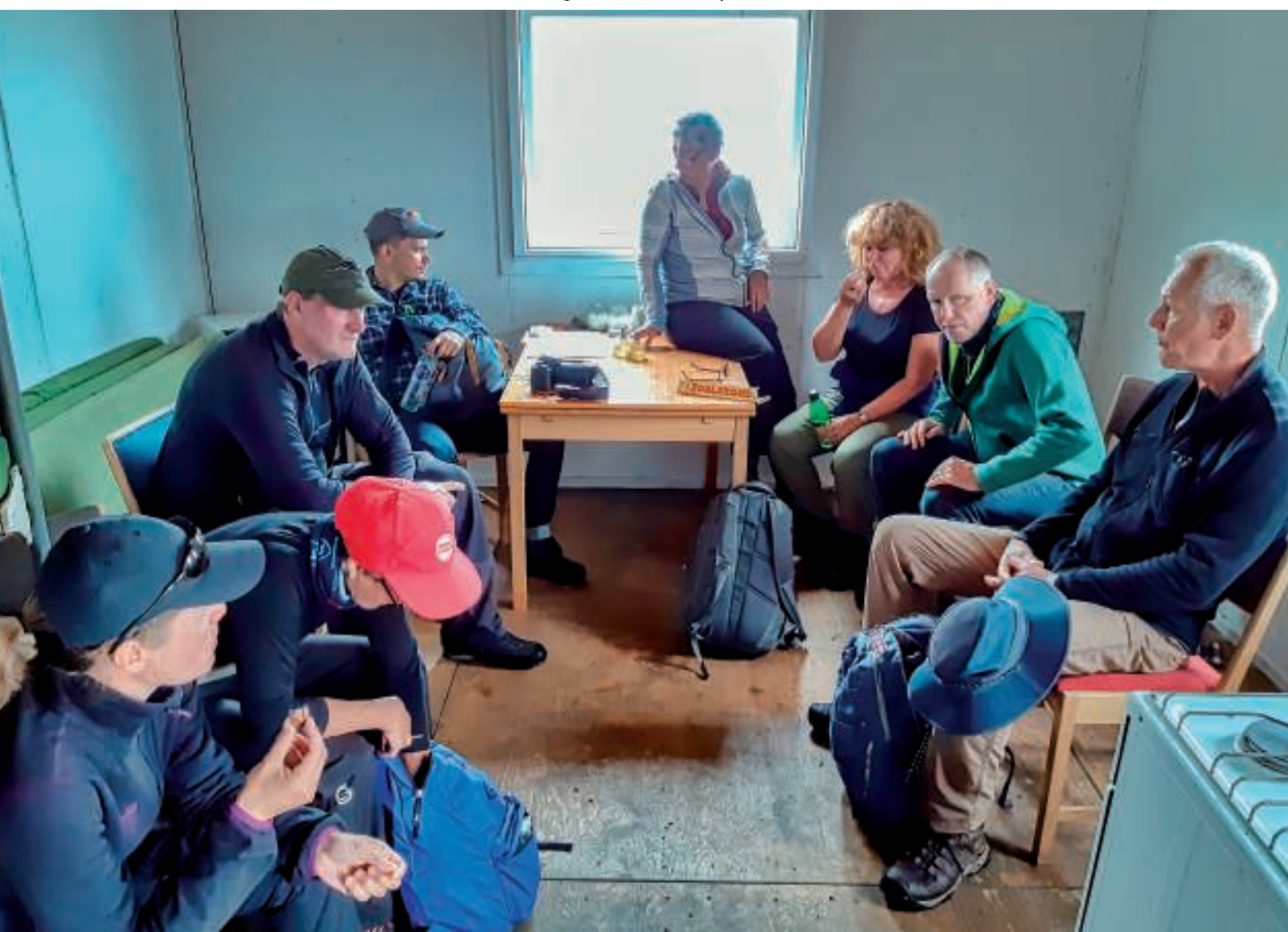
Besøg i Grønnedalshytten

Efter halvanden times vandring stod vi foran Grønnedalshytten. Det blev til et besøg og et hvil. Der var ingen hyttebog, men der var en seddel, hvorpå der stod, at nogle fangere fra Arsuk havde været forbi på moskusokse- og rensdyrjagt.