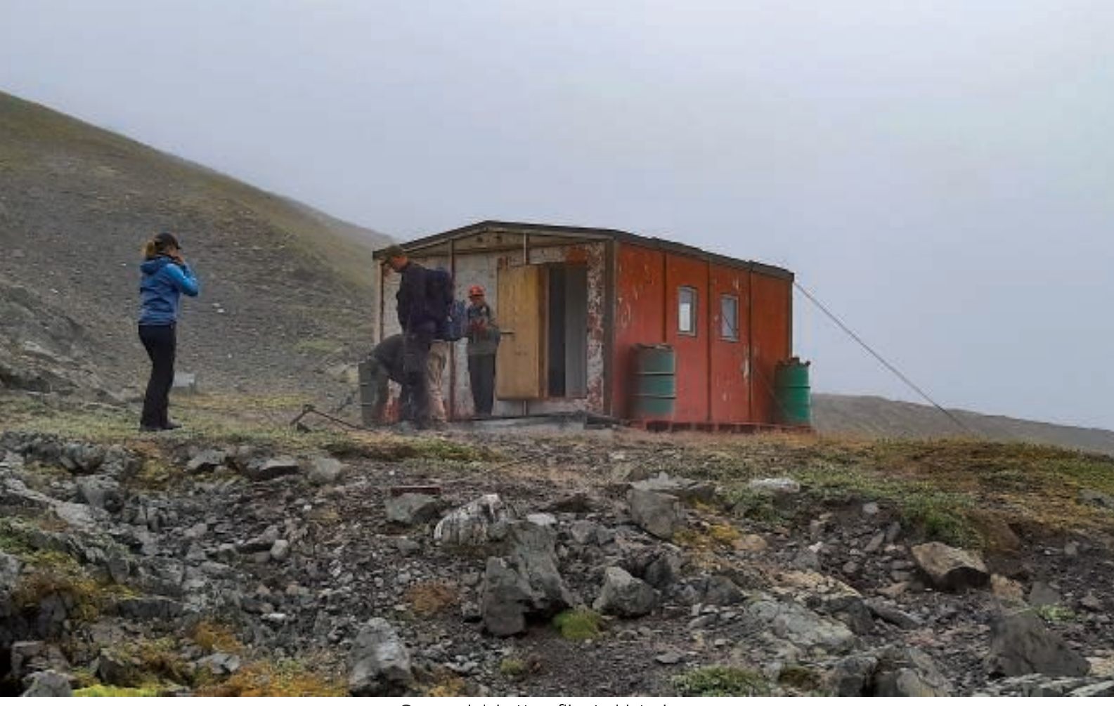
Grønnedalshytten fik et sidste besøg

Vi fulgte samme rute tilbage til Grønnedalshytten og fortsatte herfra mere eller mindre langs med bækken, der løber lige forbi hytten. Bækken møder Bryggerens Elv et stykke længere nede.