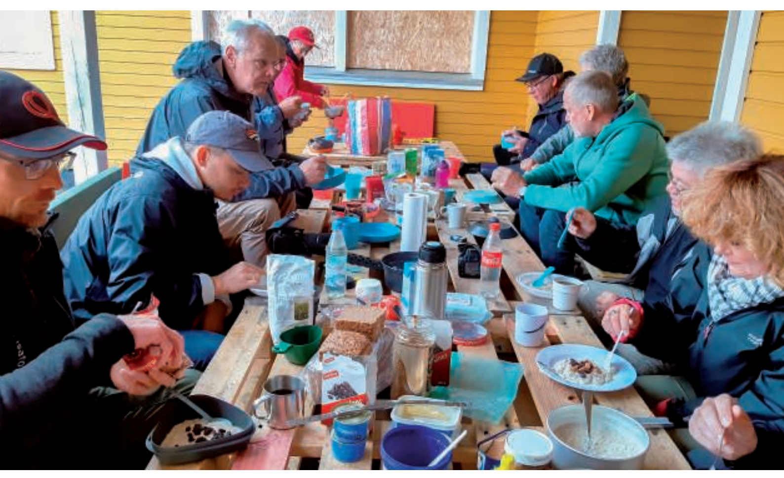
Morgenmaden nydes. Morgenmaden bestod oftest af kaffe, havregød og brød

Morgenmaden blev som vanen tro indtaget under halvtaget ved Sergentmessen med samme indhold som de øvrige dage!