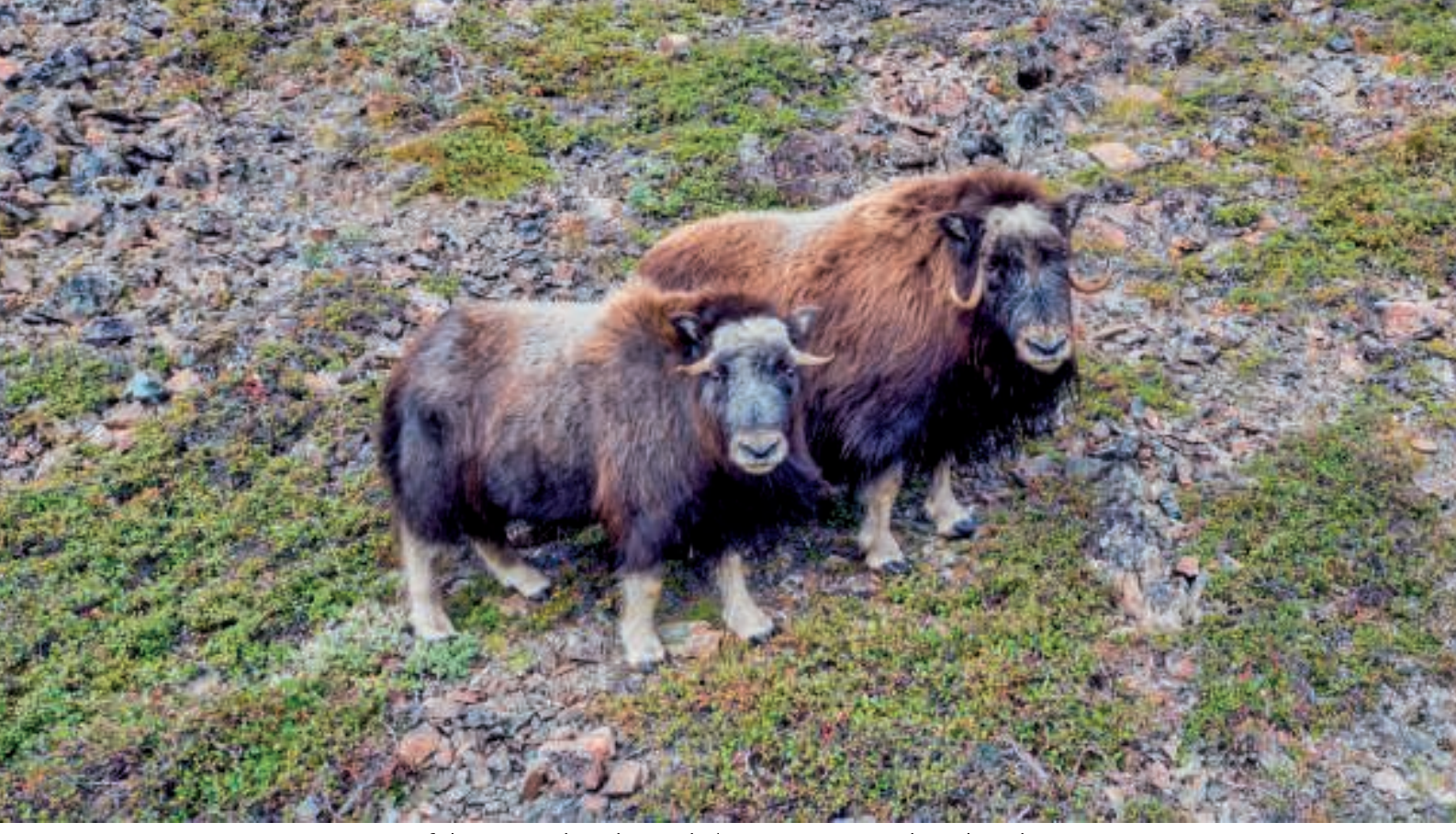
To af de tre moskusokser - kalven gemmer sig bag de voksne

Vi fik også øje på tre moskusokser, nok en lille familie, som gik på stien mod Langesø. Her kom dronerne i luften og fik filmet både okserne og Bryggerens Elv. Fra dette sted er der en flot udsigt ud over vandfaldene, kløften og de stejle skrænter.