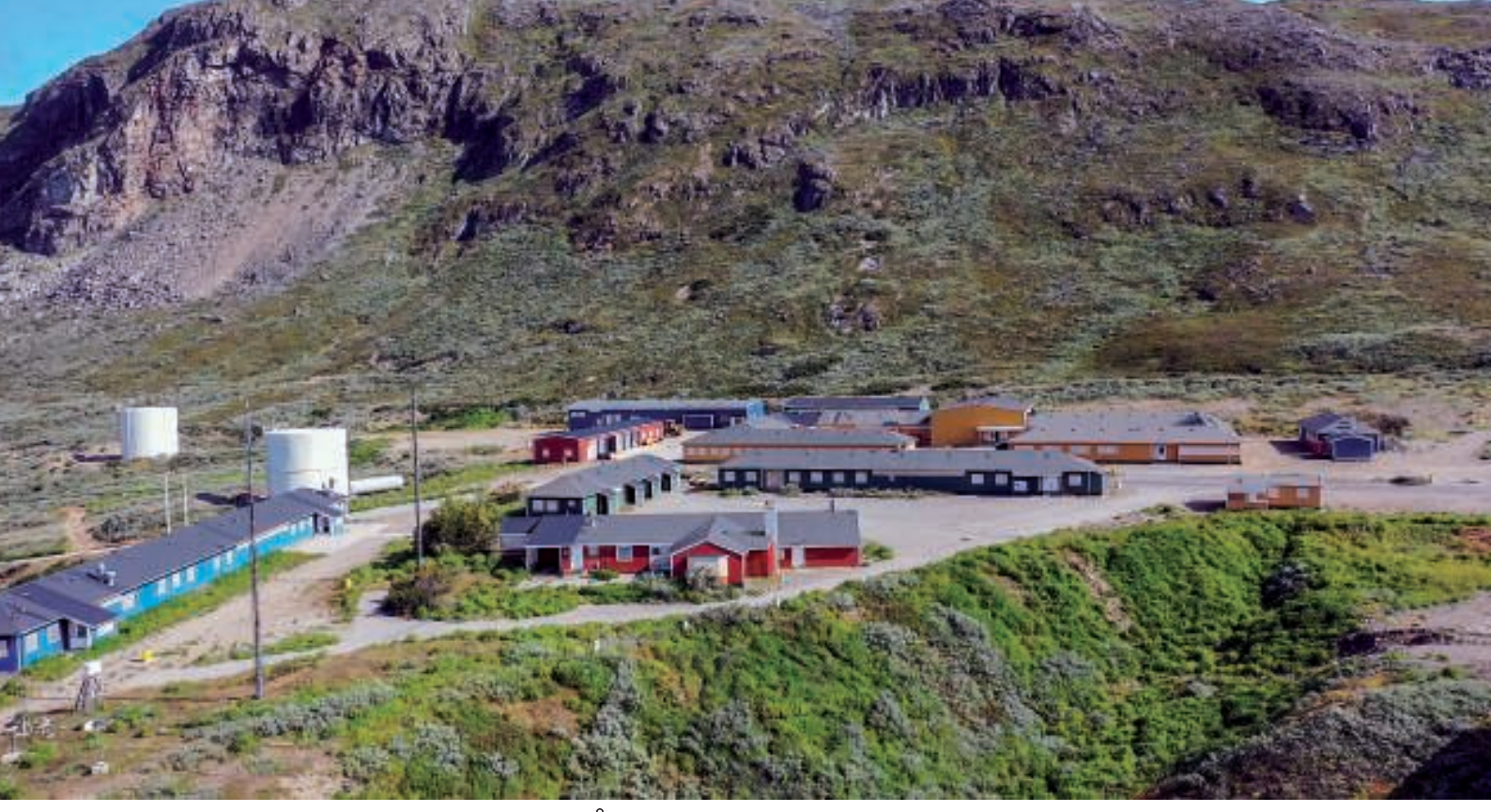
Stationsområdet med Officersmessen i forgrunden

Selv om vi i løbet af vores tid i Grønnedal, havde gået rundt og set de ændringer, som er foretaget gennem årene, så giver dronebillederne trods alt et andet illede af området.