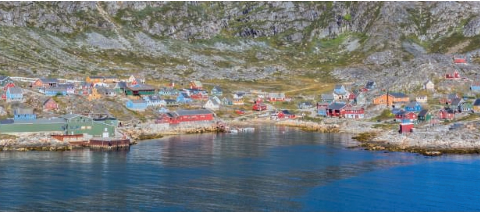
Arsuk set fra havet