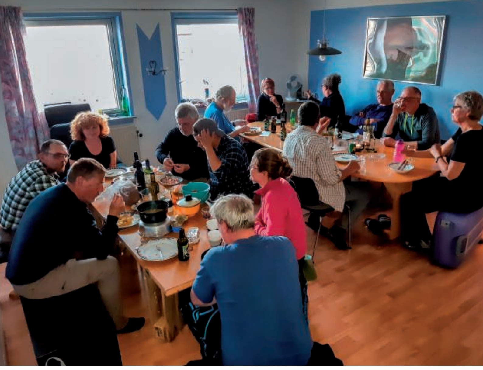
Aftenskafning i "Det lilla hus". Der var ikke megen plads

Aftenen nærmede sig, og det var tid til aftensmad. Alle rester skulle spises op, så menuen var meget varieret, og selvom pladsen i huset var noget trang, blev maden indtaget med største velbehag.