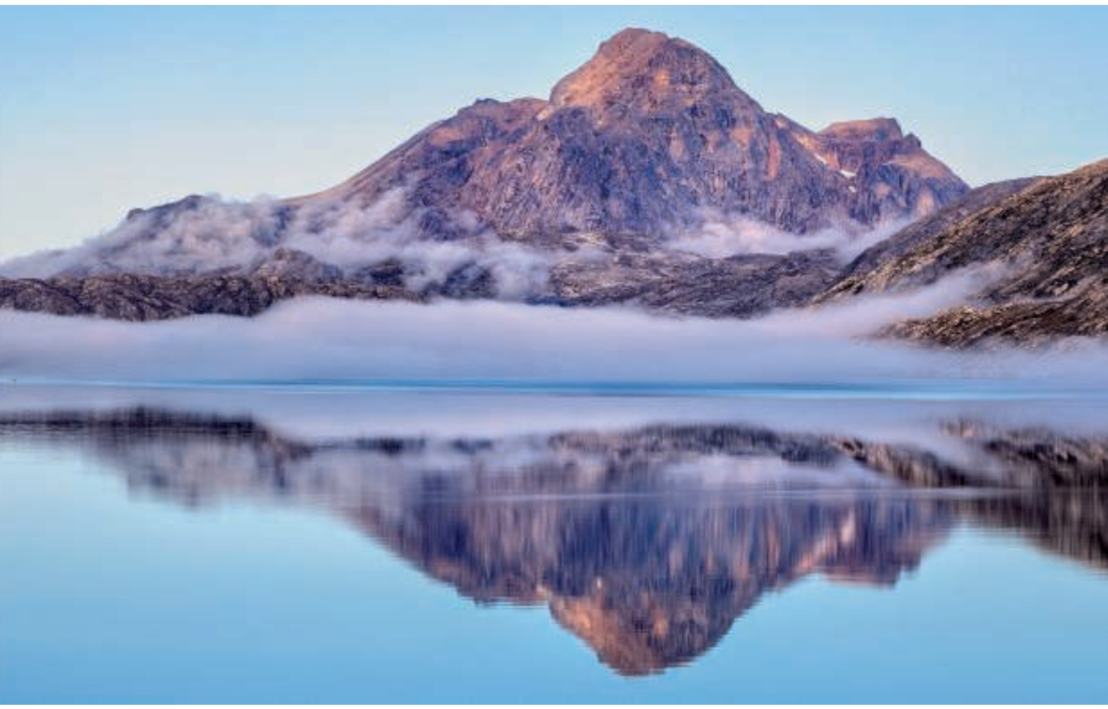
Kûgnâit-fjeldet med tågen liggende foran i et lavt bælte

Pludselig kunne vi se tågen komme væltende ind ude fra Arsukfjorden, og snart var hele området dækket med tåge, men kun i kort tid, for lige så pludseligt som tågen kom, lige så pludseligt var den væk igen.