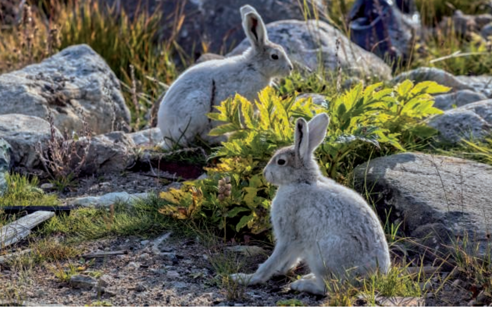
Tilbage ved huset nød vi solen. Pludselig kom to harer til syne. De var meget nysgerrige, og vi fik taget nogle fine billeder.

Dronen kom også i luften og tog lidt video og billeder.