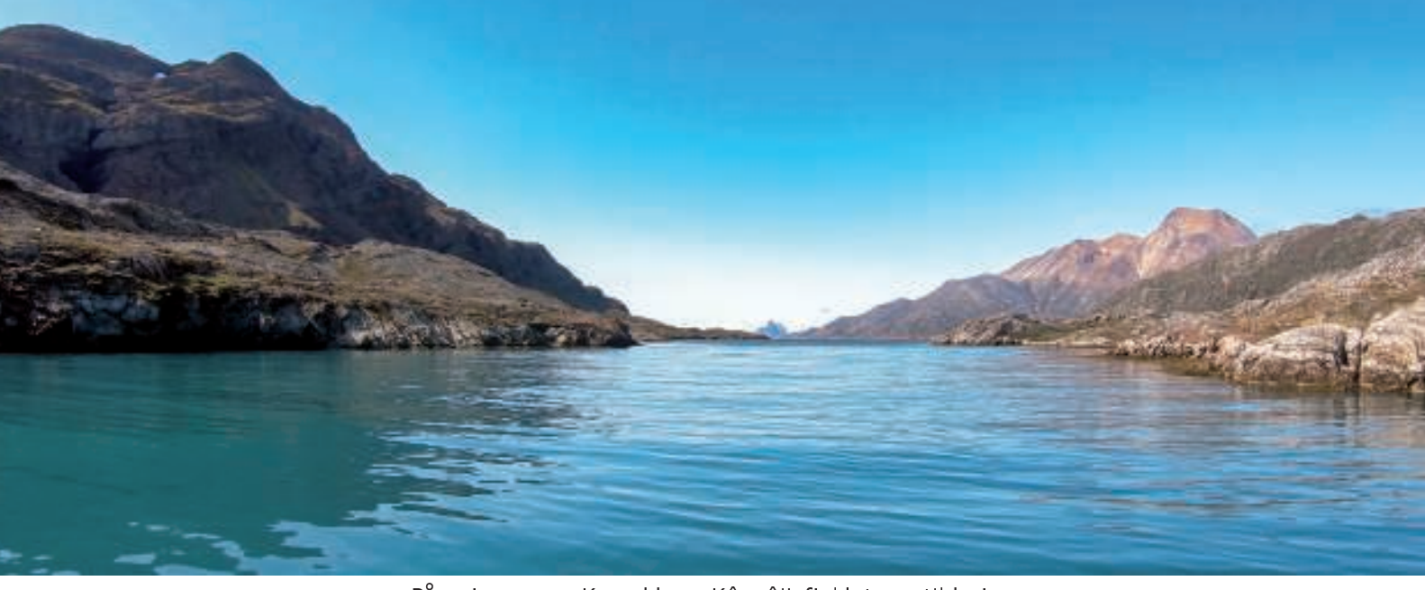
På vej gennem Karsakken. Kûgnâit-fjeldet ses til højre

Snart var Grønnedal ude af syne - en mærkelig fornemmelse. Vi fortsatte forbi Ivittuut og igennem den smalle passage "Karsakken". Kûngnâit-bugten og den velkendte top var næste mål, inden vi ankom til Arsuk.