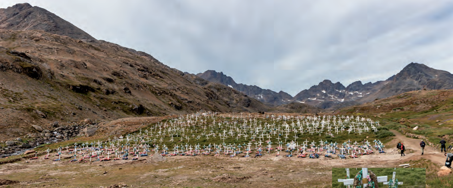
Kirkegården, som vi kom forbi

Snart var vi på vej ud ad en grussti, som førte os forbi kirkegården. Her var mange grave udsmykket med plastikblomster.