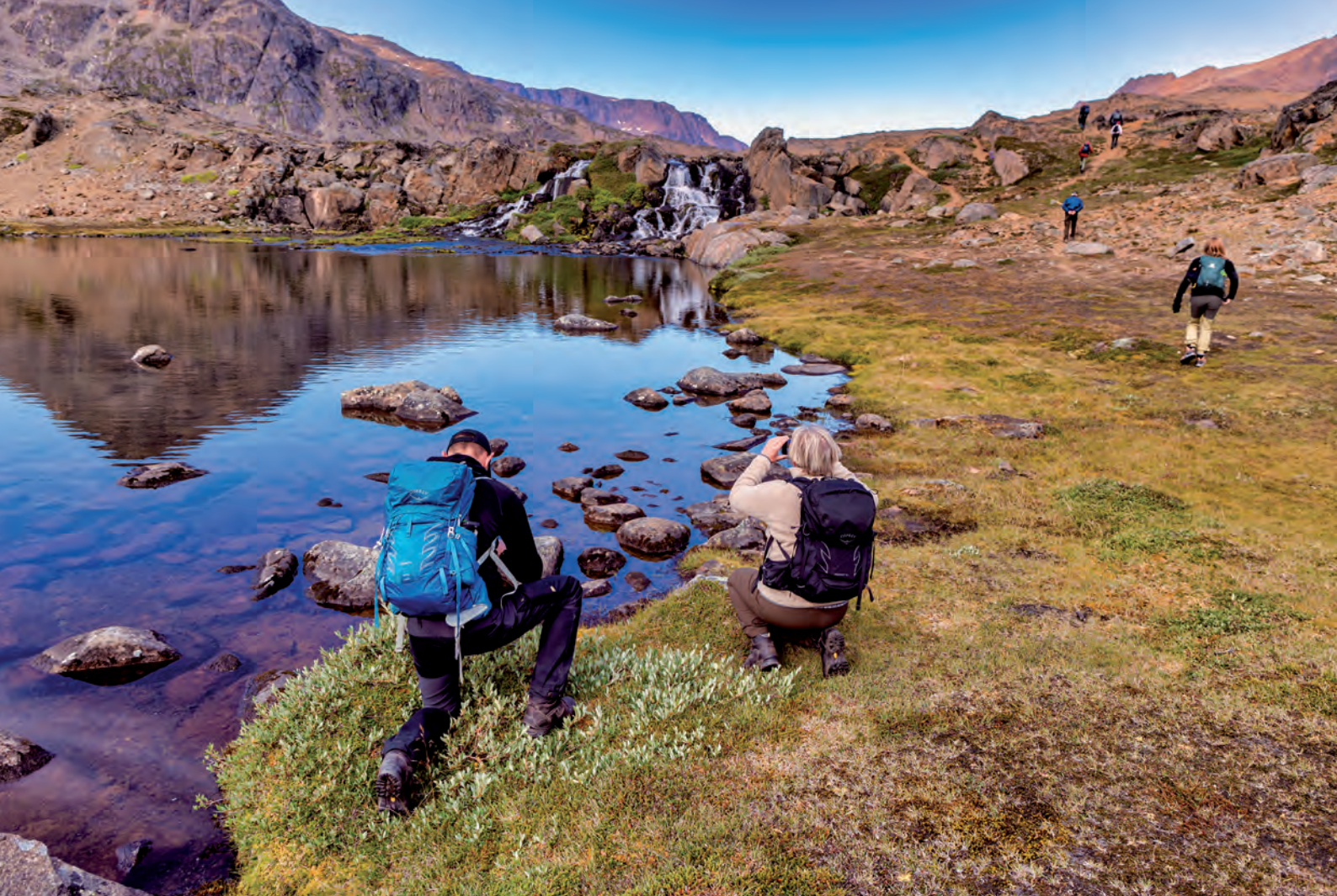
Der blev taget en del fotos af vandfaldet

Ved ankomst til det sidste vandfald, var det tid til en lille pause. Det blev her besluttet at fortsætte søen rundt. Vi fortsatte ad den lille sti. Ruten rundt om søen var noget flad uden de mange højdemeter.