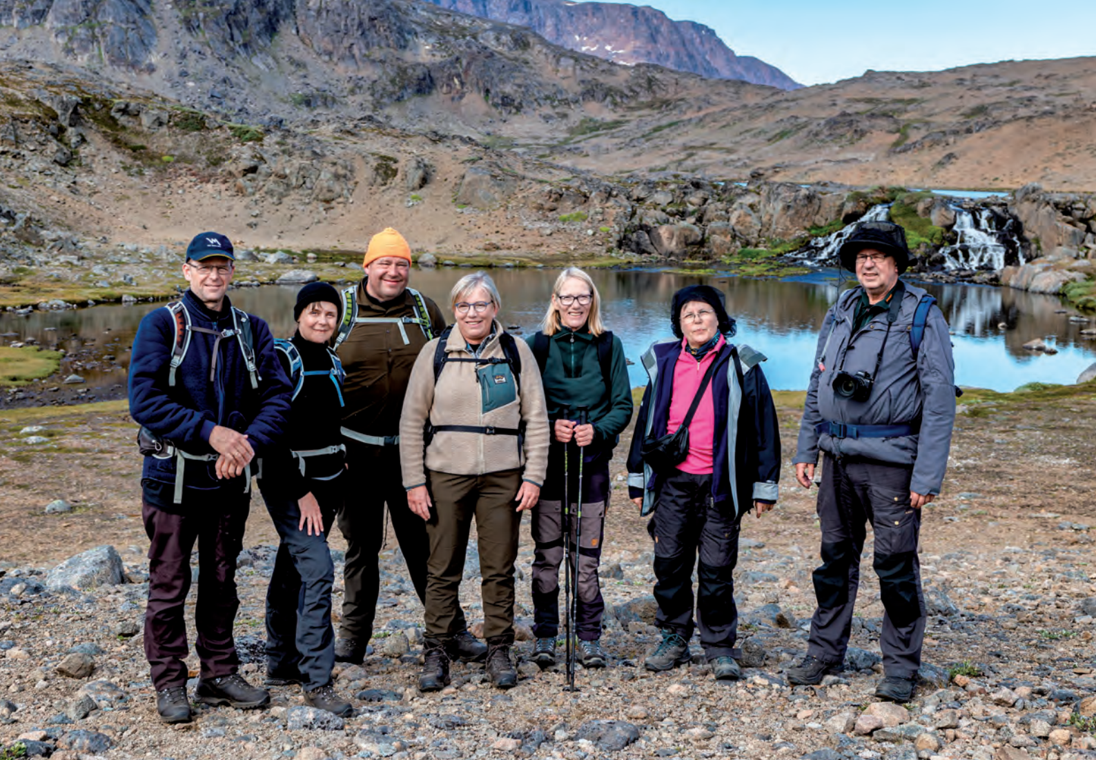
Deltagerne i vandreturen til Blomsterdalen