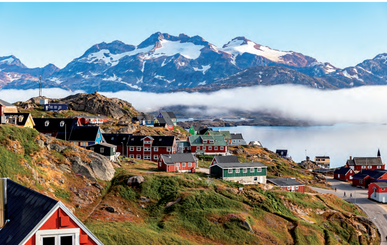
Bedre vejr kan man ikke ønske sig

Fra morgenstunden var der tåge ud over fjorden, men den littede og det skulle atter blive en dag med flot vejr.