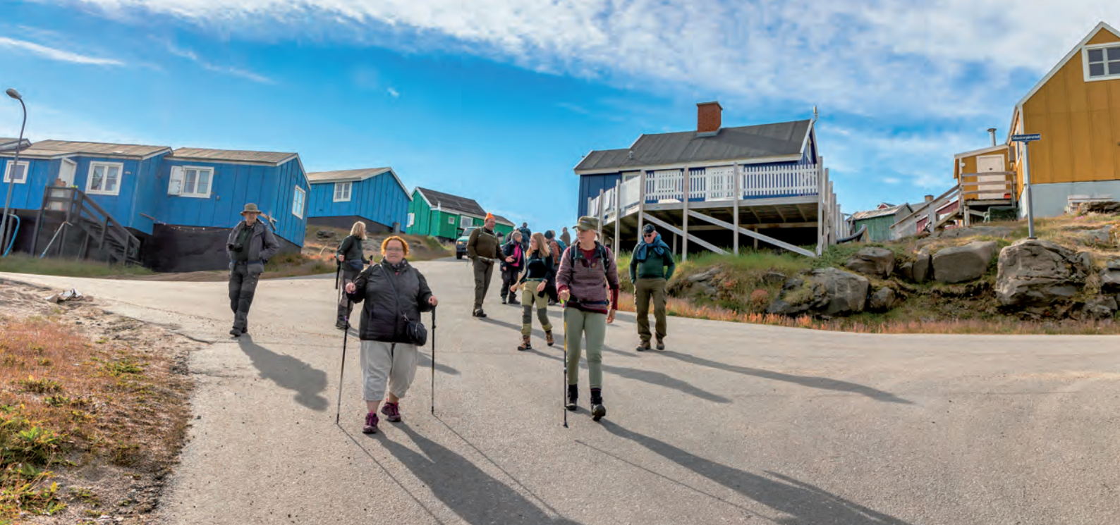
På vej ned ad den stejle bakke