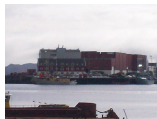
Havnen i Godthåb "Nuuk"

På badeværelset, som for øvrigt ikke havde noget brusebad, men 2 små kummer på størrelse med en dyb tallerken (nok lidt overdrevet), men her badede vi når kokken havde varmet en stor gryde vand som vi blandede med koldt fra hanen, ved at kaste vandet op over os selv.