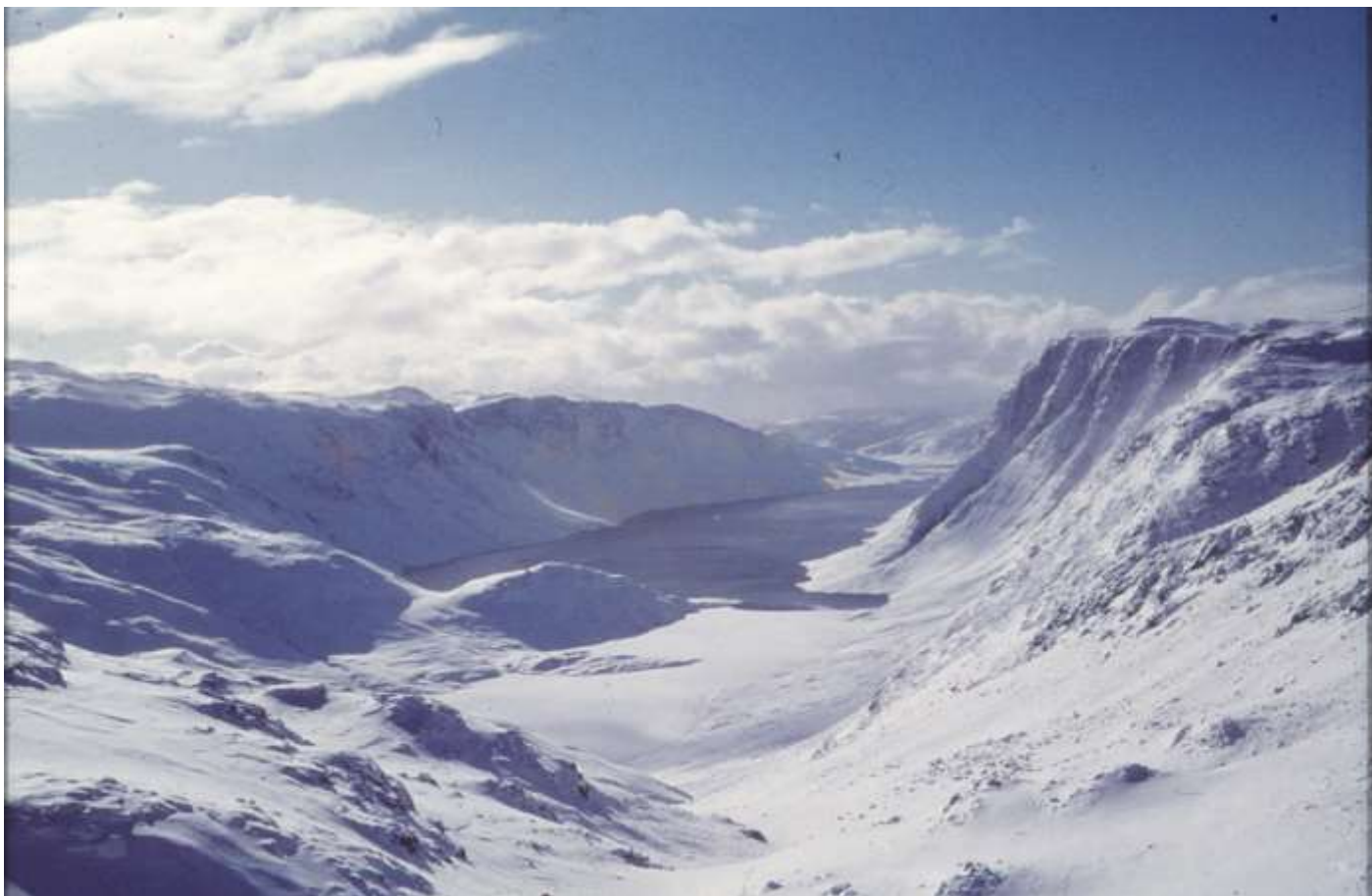
Grønlandsk vinter, med total stilhed – ikke en lyd: Ika Fjord: