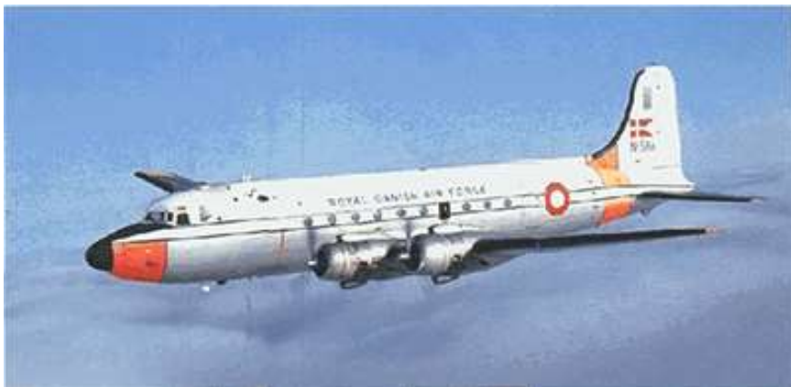
C-54 Royal Danish Air Force

Vejret var dårligt, derfor måtte vi mellemlande i Prestwick i Scotland, for næste dag at fortsætte til Keflavik, den amerikanske luftbase på Island. Her ventede vi i en uge på flyvevejr. Et par gange nåede vi en tur til Reykjavik, og oplevede byen i vintermørke. Omsider nåede vi til Narsarsuaq, der ligger på højde med Oslo. Så vi fløj ikke mod nord, men mod vest: fra Danmark til Grønland er der fire timers tidsforskel.