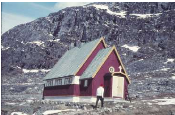
Kirken i Arsuk, hvor vi om søndagen var til gudstjeneste. med menigheden delt i mands- og kvindeside