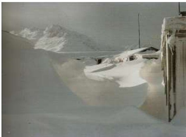
Vinter: Radiostationen indesneet