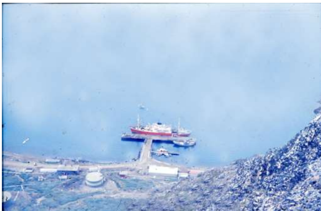
Til højre fører vejen ned til havnen, der her vises med KGH-skibet "Umanak" ved kajen. På den anden side af denne en kutter.

Basen Bluie West 7 blev under krigen anlagt af amerikanerne for at forsvare Ivigtut med kryolitminen. Kryolit var en nødvendig katalysator ved udvinding af aluminium, og eksporten til USA kunne finansiere det grønlandske samfund i de 5 år landet var afskåret fra Danmark. Stedet blev overtaget af Søværnet i 1951.