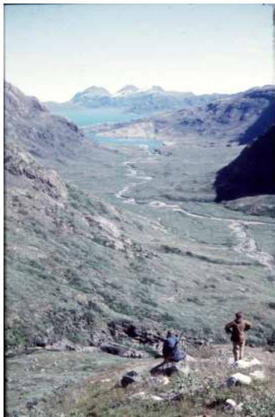
Sommerudsigt over Laksebunden