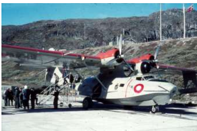
Catalina på rampen