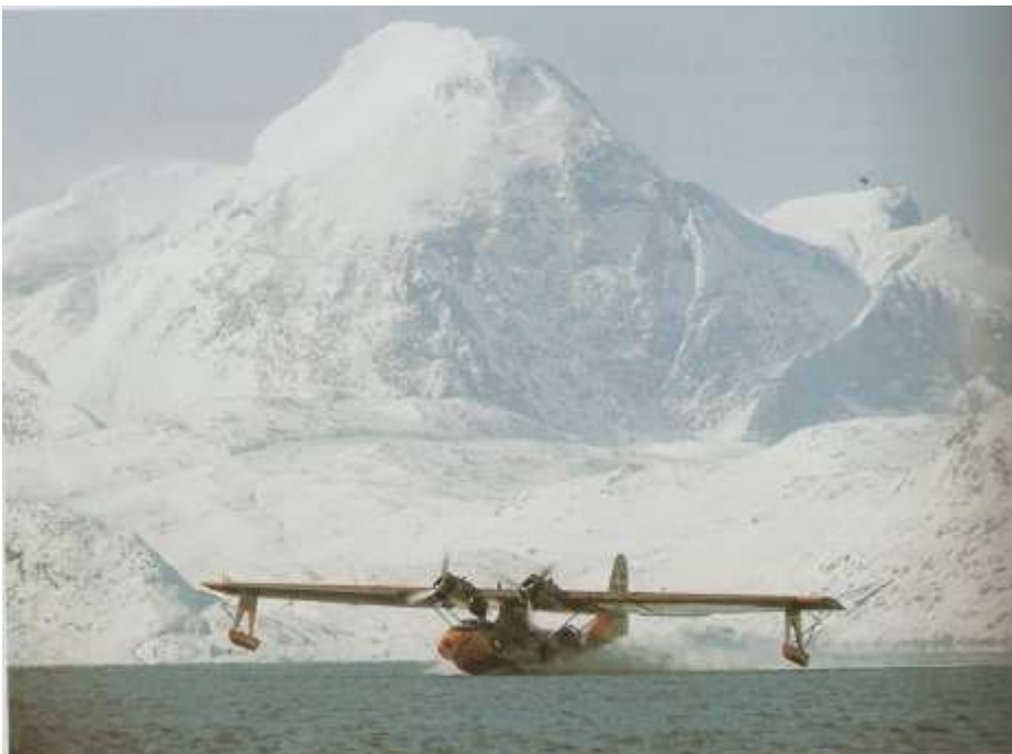
Catalina starter fra Grønnedal, med Kungniat i baggrunden

Initiativerne efterfølgende på Grønland omfattede etablering af Luftgruppe Vest med stationering af Catalinafly året rundt på Narsarsuaq, etablering af isrekognoscering med fly, og krav om regelmæssig meldepligt for alle skibe i grønlandsk farvand. Endelig blev de små, langsomme kuttere i årene efter 1962 suppleret med 4 nybyggede inspektionsskibe med helikopter, til tjeneste ved Grønland og Færøerne.