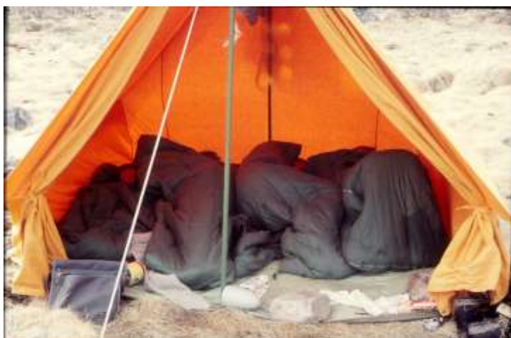
Tætpakket i telt