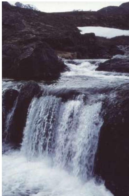
Forår: vandfald ved Taylors Havn