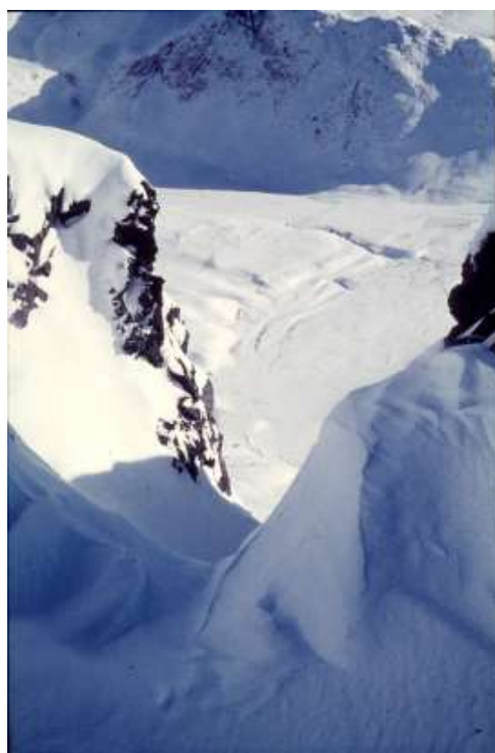
Højt oppefra: dybt nede skimtes en prik – en hytte.