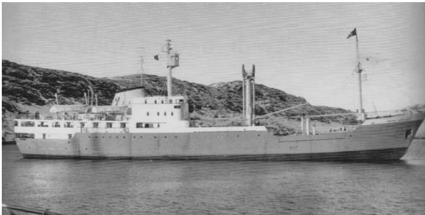
m/s Hans Hedtoft

Hele denne organisation blev etableret efter Grønlandsskibet Hans Hedtofts forlis syd for Kap Farvel 30. januar 1959 på vej hjem til Danmark efter sin jomfrurejse. Skibet gik ned med 95 personer ombord, passagerer og besætning. Sidst på året drev en redningskrans fra skibet i land på Island.