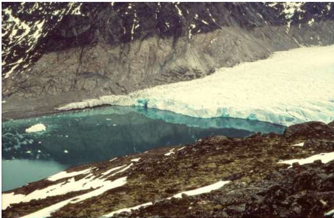
Arsuk Isbræ, som under Istiden har gået langt højere

Et pudsigt træk var søfuglenes opførsel. Vi havde set en del måger flyve planløst omkring, men efter kælvingen foer de til stedet, skreg og larmede som en flok gadedrenge, og var i lang tid meget urolige. At de skulle syntes det var sjovt, kan jeg næppe tro. Derimod har jeg en idé om, at chokket midlertidigt bedøver de fisk, der befinder sig i nærheden – de kunne blive et let bytte for mågerne.