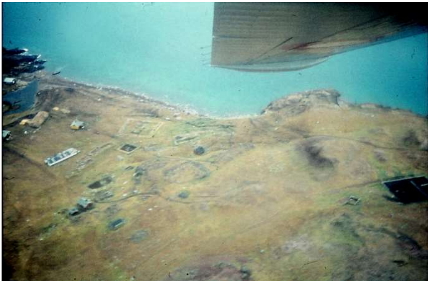
Brattalid – Erik den Rødes gård og Thjodhildurs kirke

Endelig afgang med kutter til Narsarsuaq, hvor vi fik en uges ventetid inden C-54eren kunne komme igennem. Vi var tre mand der var så heldige at komme med på en prøveflyvning med Catalina. På vej til landing kom vi over Erik den Rødes gård og kirke, som jeg fik knipset i forbifarten.