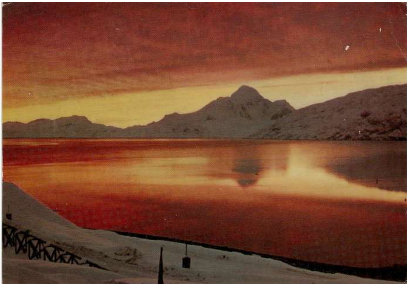
Grønnedals vartegn, Kungniat fjeldet, 1.415 meter