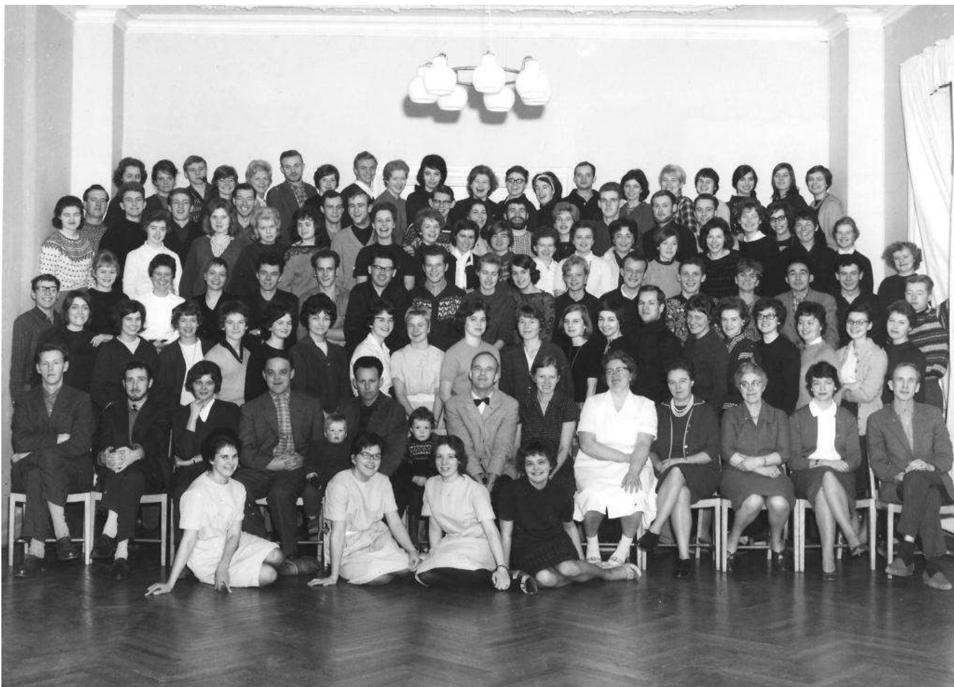
Krogerup, vinteren 1961-62

Det blev afsættet til næste kapitel i mit liv.