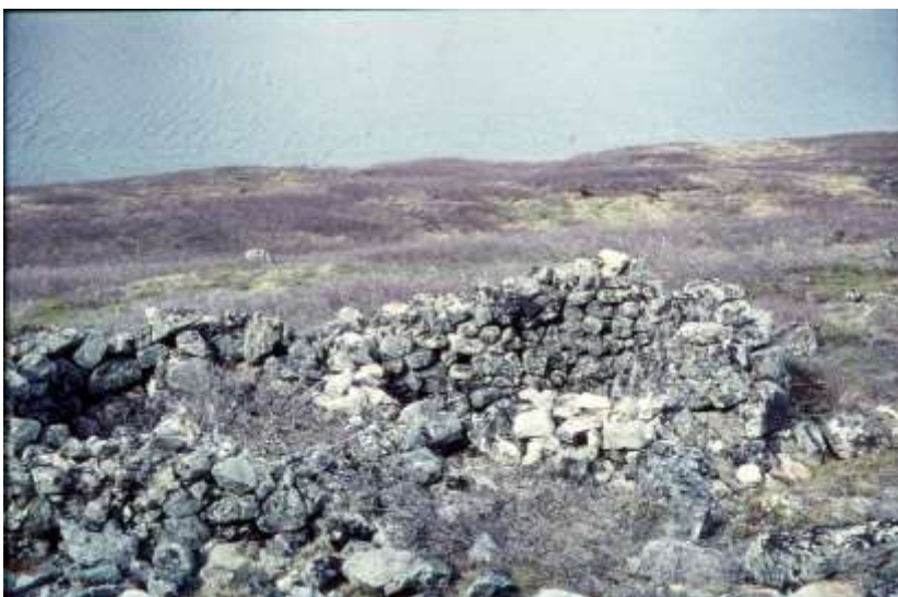
Ruin af hus fra Nordbotiden. Nordboerne indvandrede fra Island for 1000 år siden, for at forsvinde under Middelalderens Lille Istid