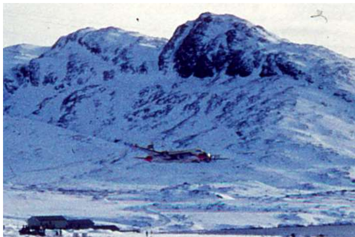
Januar: Islandske DC-4 Solfaxi dropper post