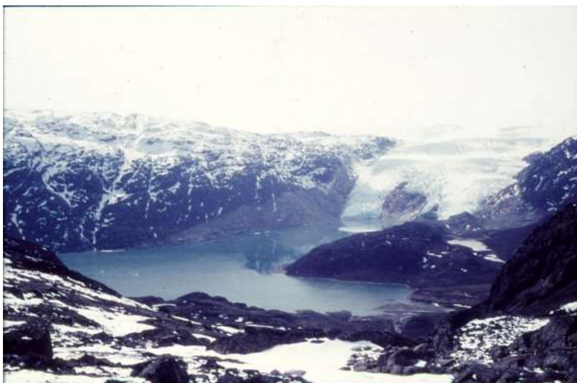
Kornok Isbræ – ved næste fjord mod øst