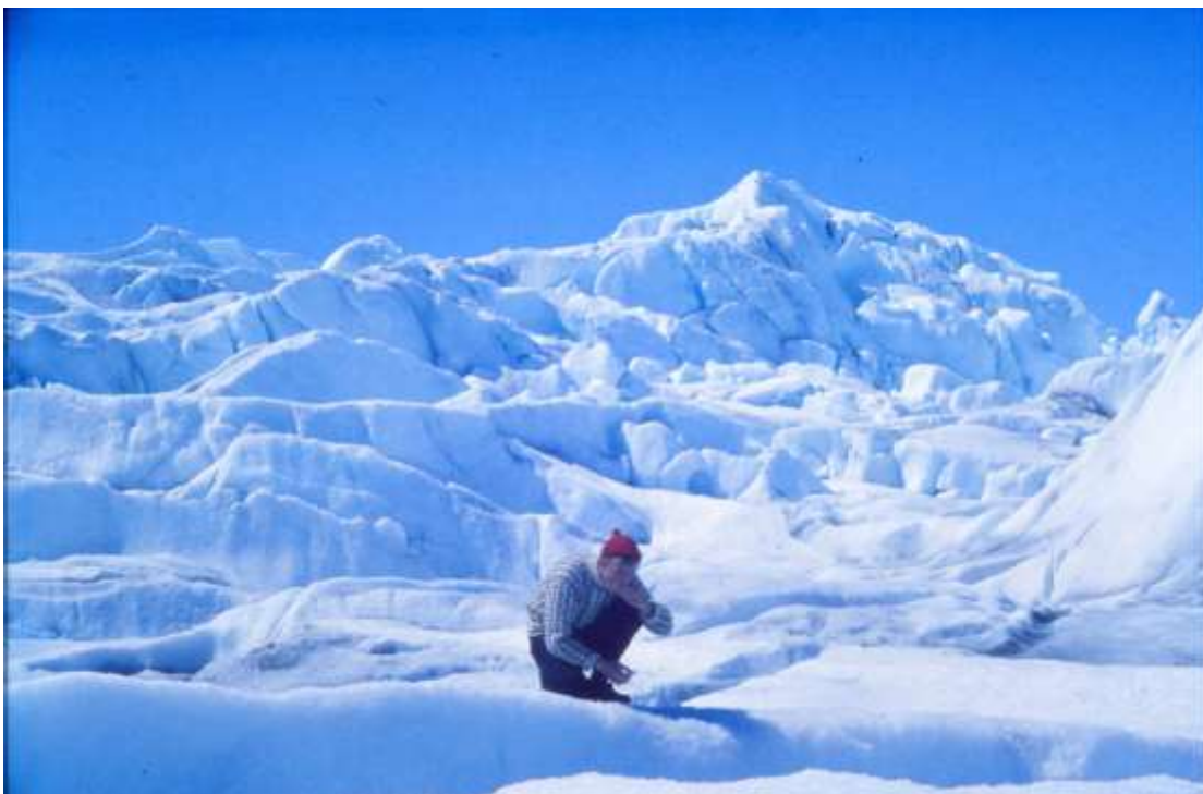
Butty ved selve ind-landsisen – på en senere tur, hvor jeg ikke var med.