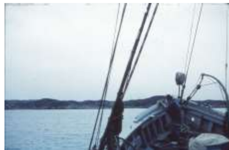
Teisten på vej til Godthåb

Uddrag. "23/9. Teisten skulle afgå 0830. En 100 tons træskutter. Maskinen på marchomdrejninger, det gik støt nordover. Vejret var gråt og surt og blæsende. Noget rullede vi. Tog en kortere rortørn, siden assisterede jeg gnisten med nogle kode-signaler. Frederikshåb, Frederikshåb Isblink så vi ikke det fjerneste til i natten. Derimod gik der flere gange stød gennem skibet ved passage af mindre bælder med drivende isskodser. Men Teisten er bygget til at klare det.