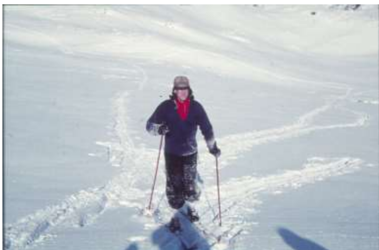
Ego på ski