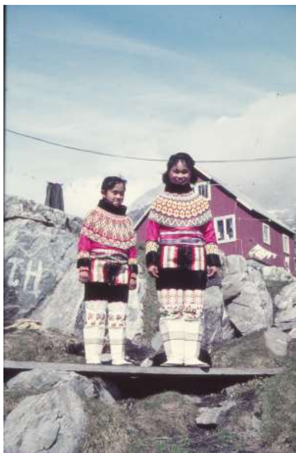
Frederiks døtre i festdragt i dagens anledning