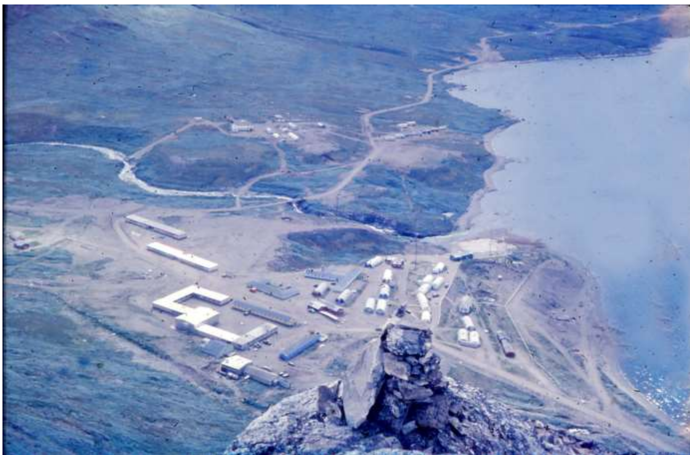
Overblik fra Bratten, med radiostationen, den mørke bygning midt i billedet. Øverst Ivigtutvejen langs fjorden, med sine fem kilometer dengang den længste vejstrækning i Grønland.

Basen Bluie West 7 blev under krigen anlagt af amerikanerne for at forsvare Ivigtut med kryolitminen. Kryolit var en nødvendig katalysator ved udvinding af aluminium, og eksporten til USA kunne finansiere det grønlandske samfund i de 5 år landet var afskåret fra Danmark. Stedet blev overtaget af Søværnet i 1951.