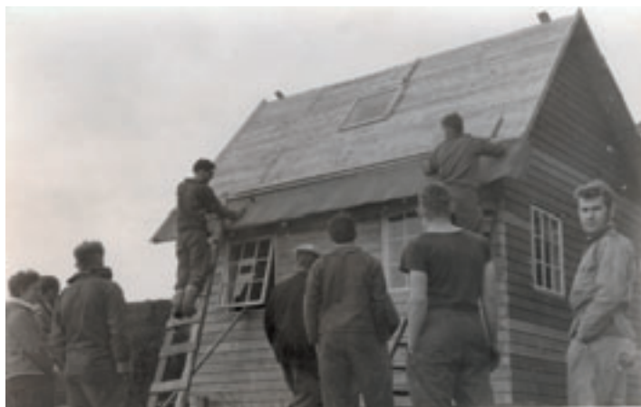
Hytten i Anguteralaq nærmer sig sin fuldendelse..

Som flyversoldat var jeg ankommet til Grønnedal midt imellem to udstationeringsperioder og faldt derfor ikke rigtigt ind i hakkeordenen. Det senest ankomne hold var jo "kagler" og fik at vide, at deres fornemste opgave var at tjene "oldbasserne", som jo altså snart skulle hjem, ikke kunne "tage sig file meget af noget" og gik med "bassebjørn" - et lille